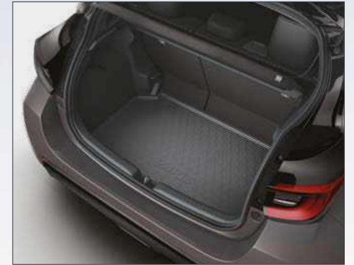
אמבטיה לתא המטען המספקת הגנה מפני לכלוך ומפני החלקה של ציוד וסחורה