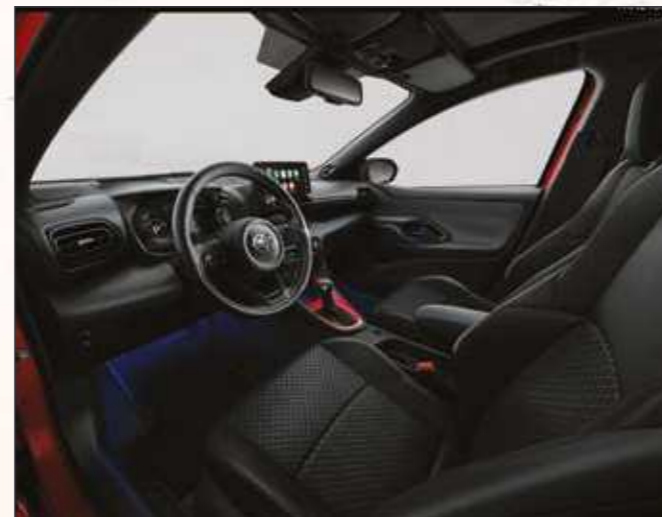
קישוט קונסולה מרכזית בצבע אדום שיהפוך את היאריס שלך לייחודית מבפנים כפי שהיא מבחוץ