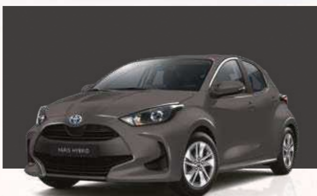
אפור מטאלי 1G3