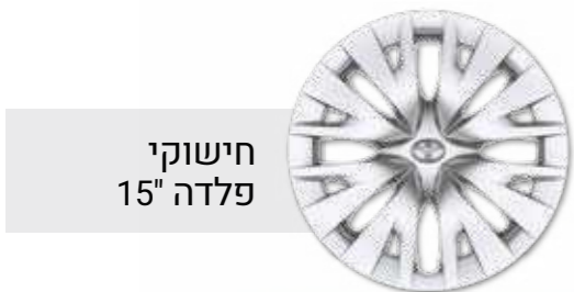
חישוקי פלדה 15"

*מומלץ לבדוק את תאימות הטלפון הנייד שברשותך למערכת ה-Bluetooth המותקנת ב-YARIS. את הבדיקה ניתן לעשות בלינק הבא: www.toyota-tech.eu/bluetooth/search.aspx **נכון למועד פרסום קטלוג זה, אפליקציית Android Auto אינה זמינה בישראל. ***פעילות ה-E-call תלויה ברשת הסלולרית הנמצאת בקרבת הרכב בעת שידור המידע.