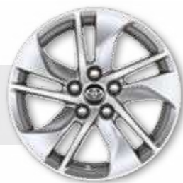
חישוקי סגסוגת קלה 15"