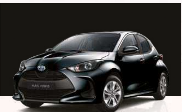
שחור מטאלי 209