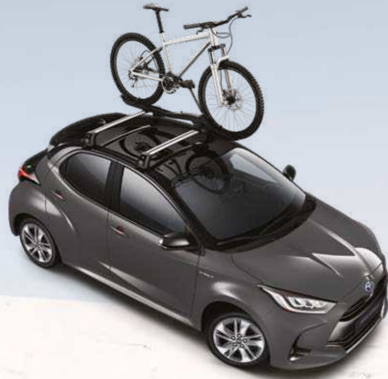
מוטות-רוחב, עבור מגוון אביזרי גג ומתקני אופניים