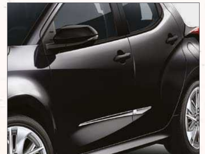
סט פסי קישוט בצבע כרום שישפקו ליאריס שלך מראה קלאסי בעל נגיעה אלגנטית