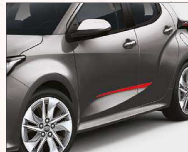
סט פסי קישוט בצבע אדום שיגרמו לראשים להסתובב בזכות נגיעת הצבע הנועזת שהם מוסיפים לרכב