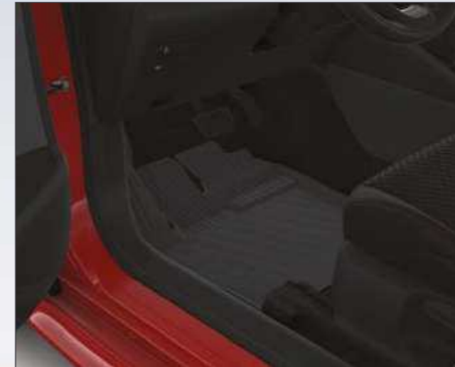
שטיחי גומי המגנים על פנים הרכב מפני לכלוך וניתנים להסרה ולניקוי פשוט