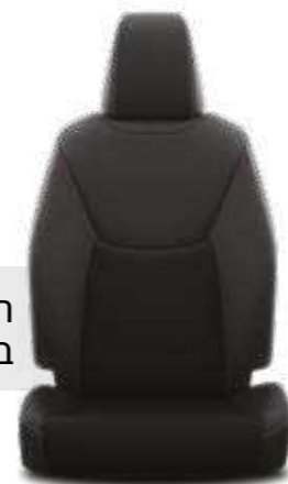
ריפודי בד בצבע שחור