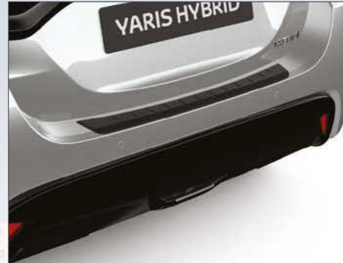
מגן פגוש אחורי המגן על הפגוש בעת טעינה ופריקה של סחורה מתא המטען