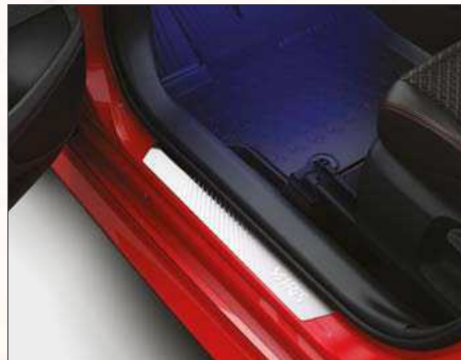
סט קישוטי סף קדמיים מקוריים היוצרים רושם מידי של סטייל, ובמקביל מגנים על סף הדלת מפני לכלוך ושריטות