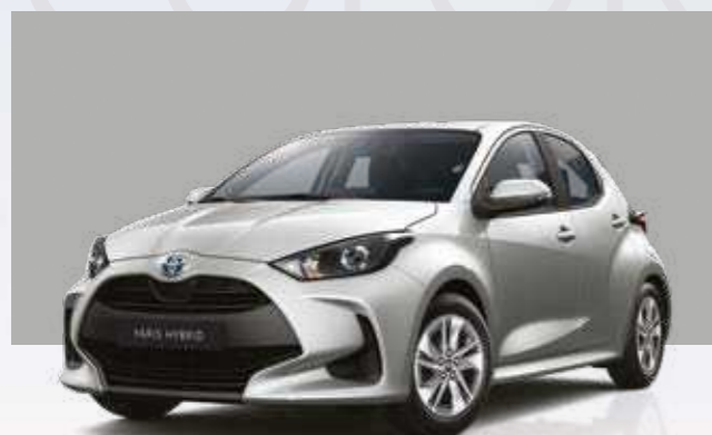
כסוף מטאלי 1L0