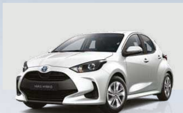
לבן צחור 040