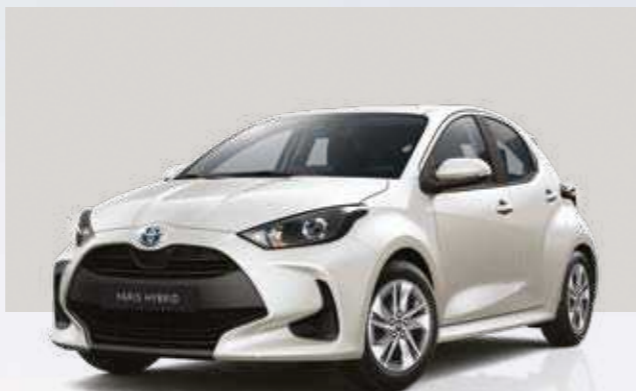
לבן פנינה מטאלי 089