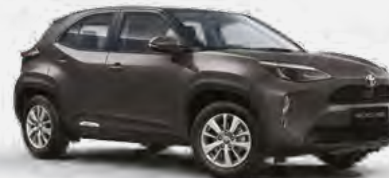
אפור כהה מטאלי 1G3