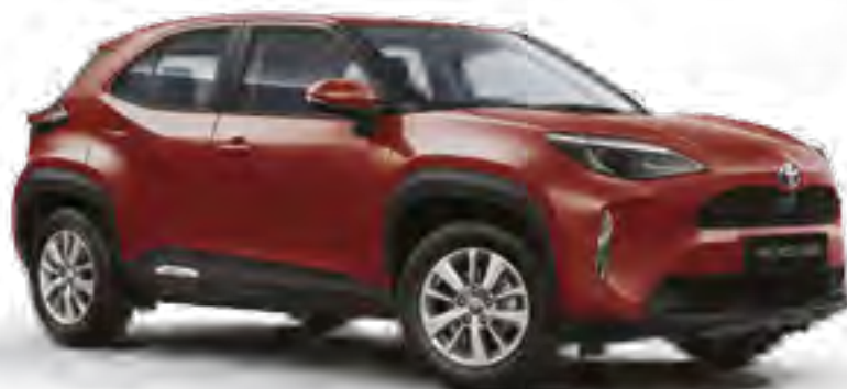
אדום מטאלי 3U5