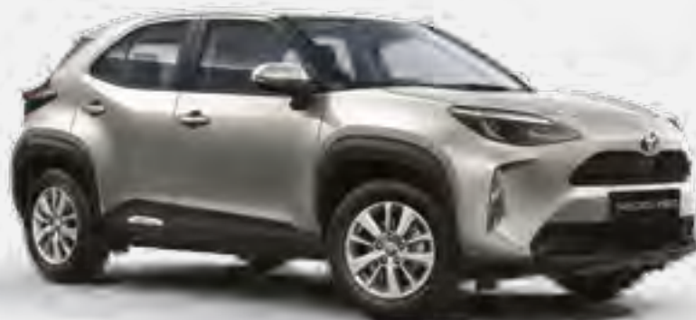
כסוף מטאלי 1L0 מטאלי