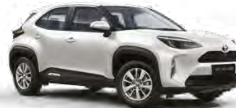
לבן צחור 040