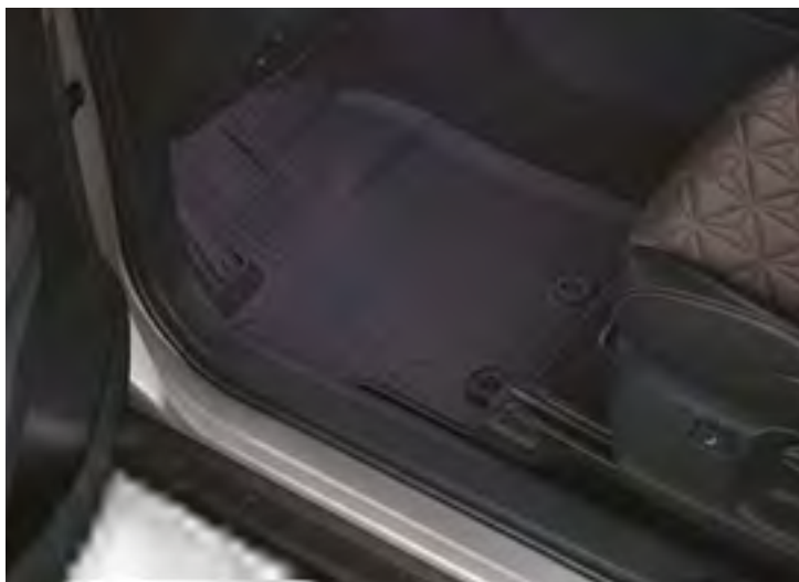
שטיחי גומי המגנים על פנים הרכב מפני לכלוך מבחוץ וניתנים להסרה לניקוי קל ופשוט