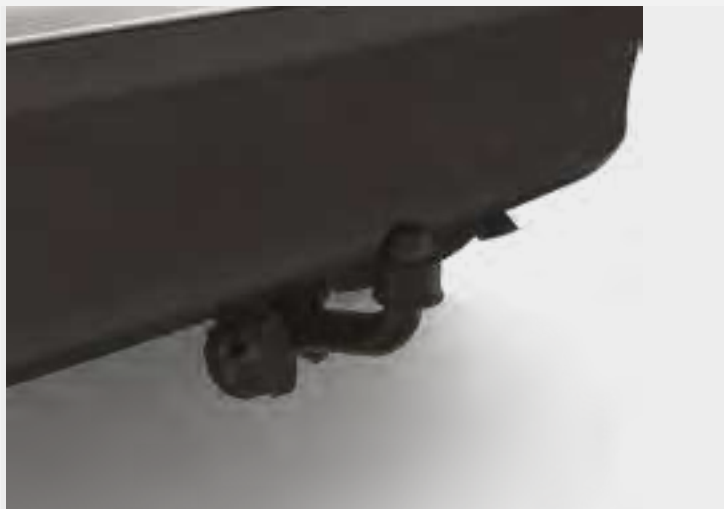
וו גרירה קבוע*