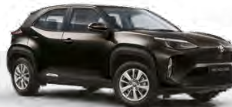
שחור מטאלי 209