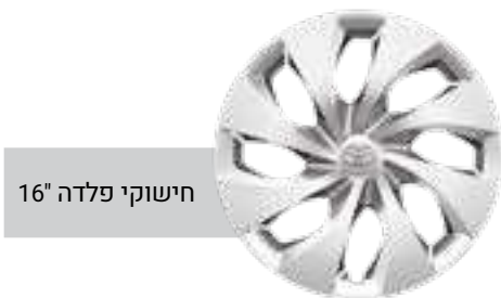
חישוקי פלדה 16"

*מומלץ לבדוק את תאימות הטלפון הנייד שברשותך למערכת ה-Bluetooth המותקנת ב-YARIS CROSS. את הבדיקה ניתן לעשות בלינק הבא: www.toyota-tech.eu/bluetooth/search.aspx **נכון למועד פרסום קטלוג זה, אפליקציית Android Auto אינה זמינה בישראל. ***פעילות ה-E-Call תלויה ברשת הסלולרית הנמצאת בקרבת הרכב בעת שידור המידע.