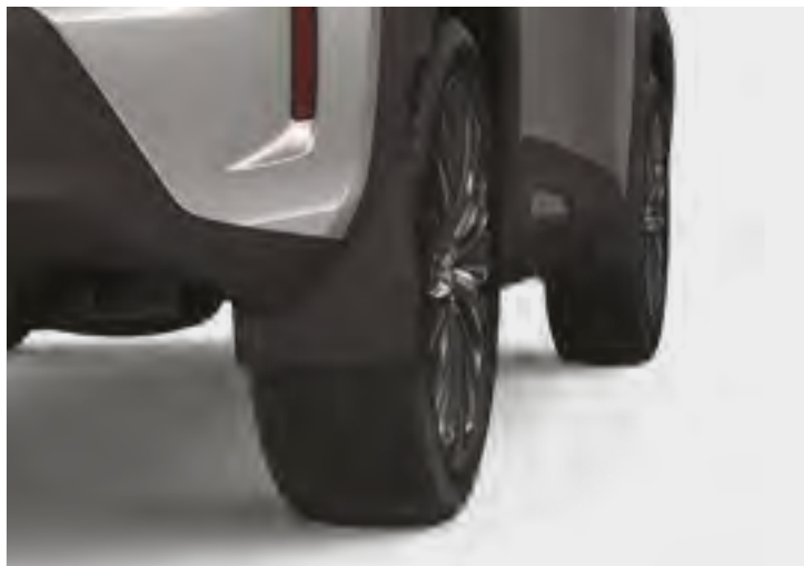
סט מגיני בוץ קדמיים ואחוריים, שיעזרו למזער כתמי מים ובוץ על הרכב