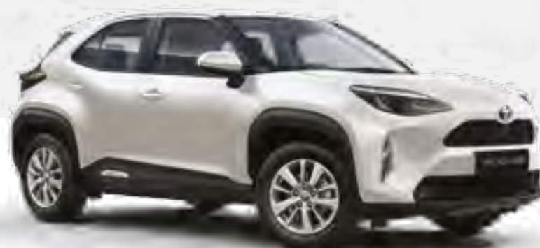
לבן פנינה מטאלי 089