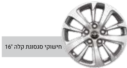
חישוקי סגסוגת קלה 16"