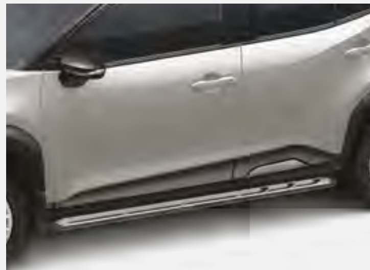
מדרגות צד המעצימות את המראה המחוספס של הרכב. שבנוסף מסייעות להגיע לגג הרכב בצורה קלה ופשוטה יותר