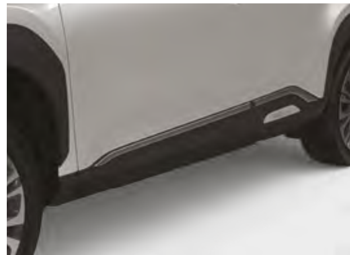
הוסיפו פס קישוט כרום לדלתות, והעניקו לרכב מראה עוצמתי לנגיעה נוספת של סטייל המותאם למראה של העיר