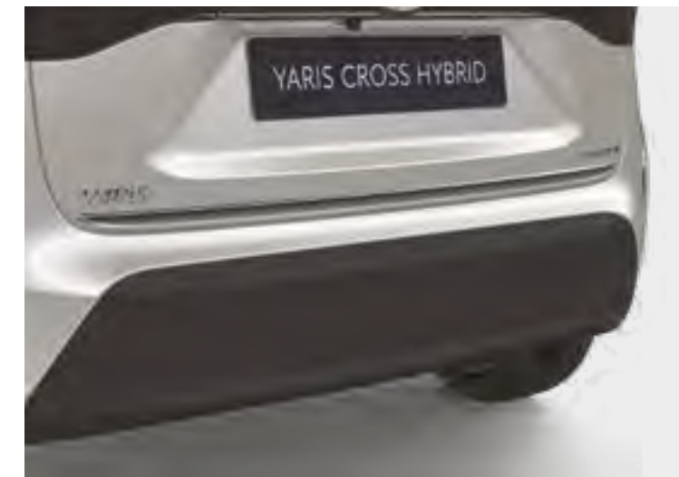
הוסיפו קישוט כרום המדגיש את עיצוב הפגוש האחורי ומבליט את המראה הייחודי של הרכב