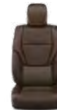
ריפוד עור בצבע אדמה זמין ברמות גימור SAHARA SKY, FIRST EDITION (כתלות בצבע חיצוני)