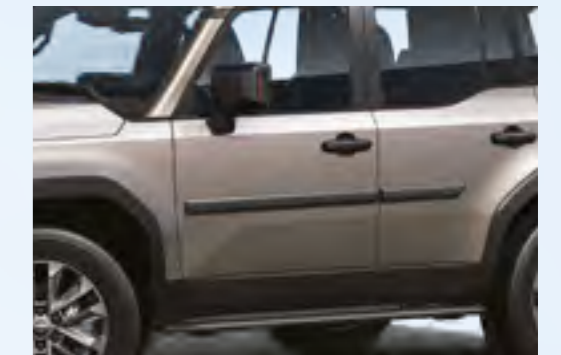
פסי הגנה לדלתות מספקים שכבת הגנה נוספת, שמגנה על צדי הרכב מפני מכות קלות ושפשופים, מגיעים בעיצוב אלגנטי