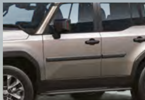
פסי הגנה לדלתות