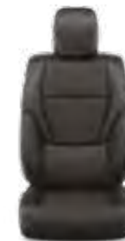
ריפוד עור מלאכותי בצבע שחור זמין ברמות גימור LUXURY, LIMITED SKY