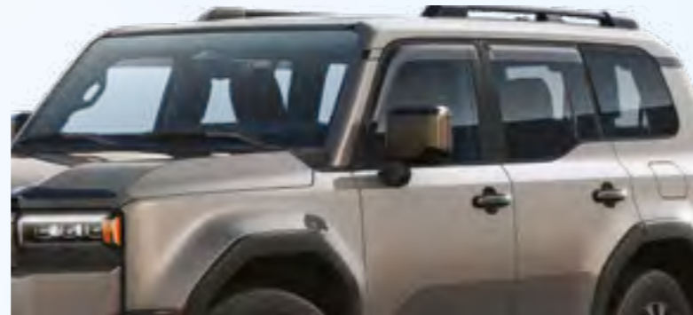
מגיני רוח פתרון מושלם לנסיעות נוחות ללא רעשי רוח ובאווירה רגועה, עשויים מחומרים עמידים, ומותאמים בצורה מושלמת לרכב