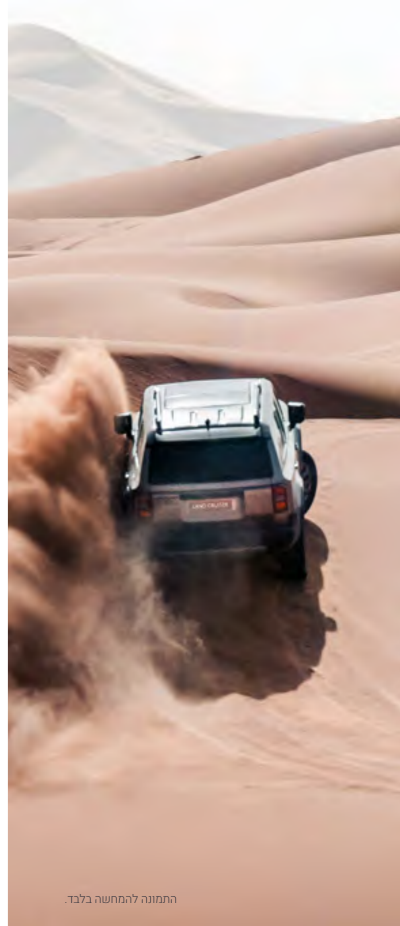
התמונה להמחשה בלבד.