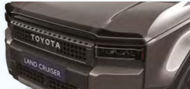
מסית רוח למכסה המנוע הפתרון האידיאלי להפחתת רעשי רוח ולשיפור היעילות האווירודינמית של הרכב בעיצוב ספורטיבי אלגנטי וכמובן עשוי מחומרים עמידים