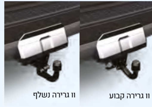
וו גרירה נשלף וו גרירה קבוע