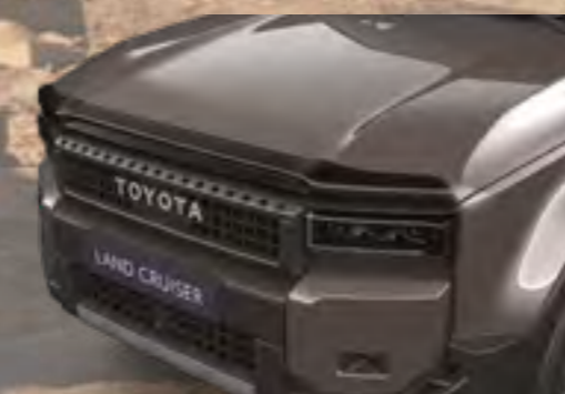
מסית רוח - מכסה מנוע