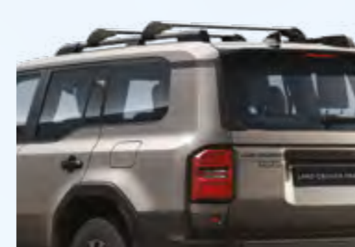
מוטות רוחב הפתרון המושלם להרחבת אפשרויות ההובלה. מוטות הרוחב מותאמים במיוחד למוטות האורך המתקנים ברכבך, יחד הם יוצרים בסיס בטוח לנשיאת מטען. המוטות ניתנים לפירוק והרכבה מהירים ובעלי יכולת העמסה של עד 100 ק"ג