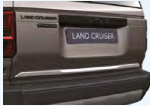
קישוט כרום לדלת תא מטען מגע של יוקרה וייחודיות לאורך הקצה התחתון של דלת תא המטען של המכונית שלך