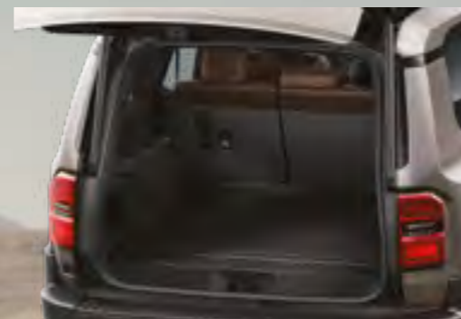
משטח הגנה לתא מטען