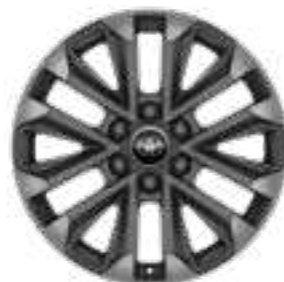
חישוקי סגסוגת קלה 20" זמין ברמת גימור SAHARA SKY