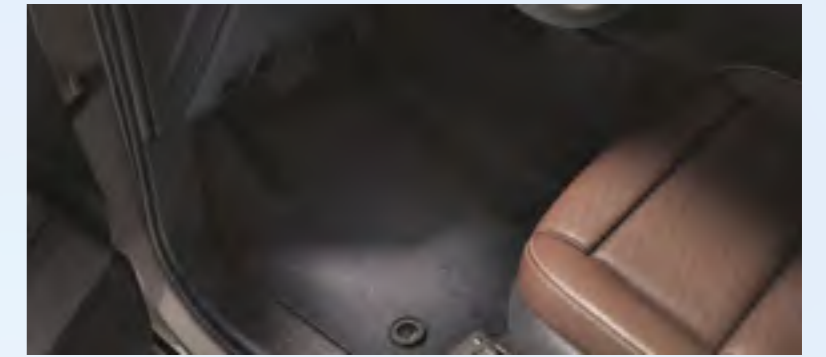
שטיחי גומי הגנה מרבית מפני לכלוך ונוזלים, עמידים וקלים לניקוי. מותאמים בדיוק למבנה הרכב ושומרים על רצפת הרכב נקייה בכל תנאי מזג האוויר