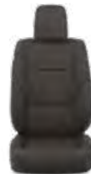
ריפוד בד בצבע שחור זמין ברמת גימור SELECT