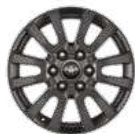
חישוקי סגסוגת קלה 18" זמין ברמת גימור SELECT