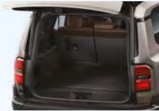
משטח הגנה לתא המטען שמור על תא המטען שלך נקי ומוגן מפני לכלוך, נוזלים ושריטות. עמיד, קל לניקוי, ומותאם בצורה מושלמת