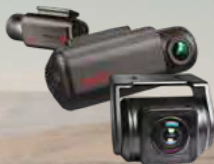
מצלמת DVR מצלמת דרך קדמית ואחורית מתעדת כל אירוע בכביש