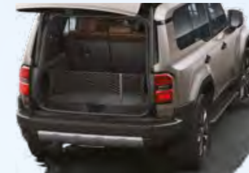
רשת אנכית לתא המטען שמירה על סדר ובטיחות בזמן הנסיעה. מונעת תזוזת חפצים, עשויה מחומרים עמידים וגמישים, ומותאמת באופן מושלם לתא המטען של הרכב