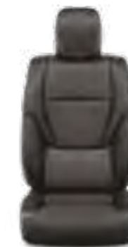
ריפוד עור בצבע שחור זמין ברמת גימור SAHARA SKY (כתלות בצבע חיצוני)