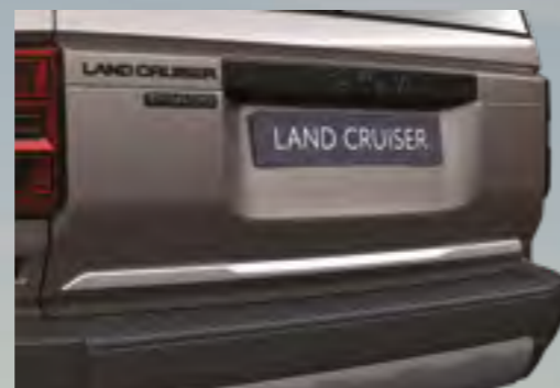
קישוט כרום לדלת תא מטען