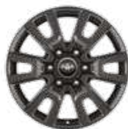
חישוקי סגסוגת קלה 18" זמין ברמת גימור LUXURY