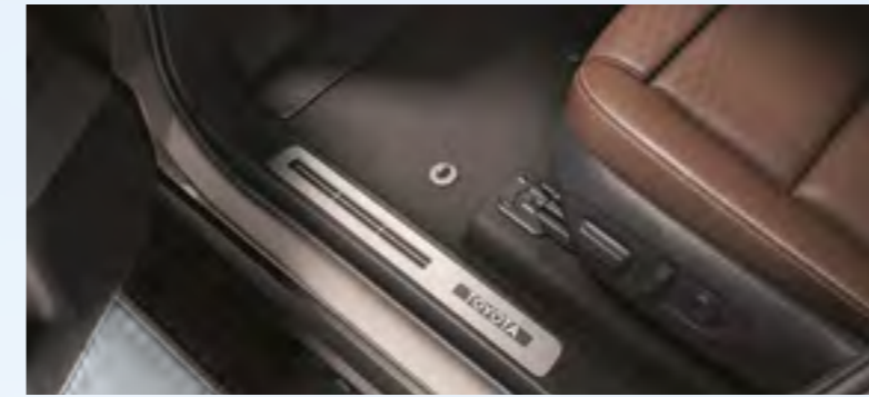
פס קישוט סף דלת מואר הפס המואר מייצר מראה מודרני ומרהיב, עם תאורה שמאירה את אזור הכניסה לרכב בחשכה. עשוי מחומרים איכותיים ומשדרג את חוויית הנסיעה