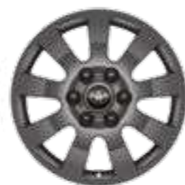
חישוקי סגסוגת קלה 18" זמין ברמות גימור LIMITED SKY, FIRST EDITION