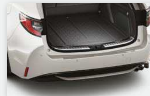
פס הגנה פגוש אחורי

PROTECTION PACK+ בתוספת חיישני חניה אחוריים - זמין ברמות גימור אקטיב ודינאמיק