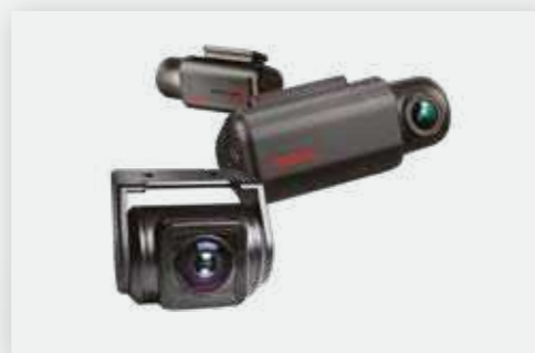
מצלמת DVR מצלמת דרך קדמית ואחורית מתעדת כל אירוע בכביש