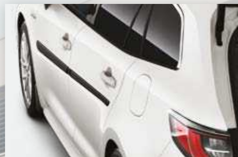
פסי הגנה שחורים לדלתות