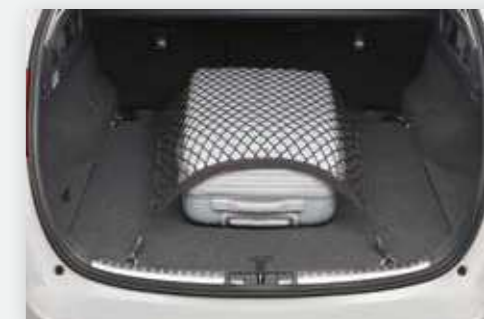
רשת המתחברת אל ווים בתא המטען ומספקת פתרון אידיאלי למניעת החלקה של תיקים ופריטים דומים בתא המטען