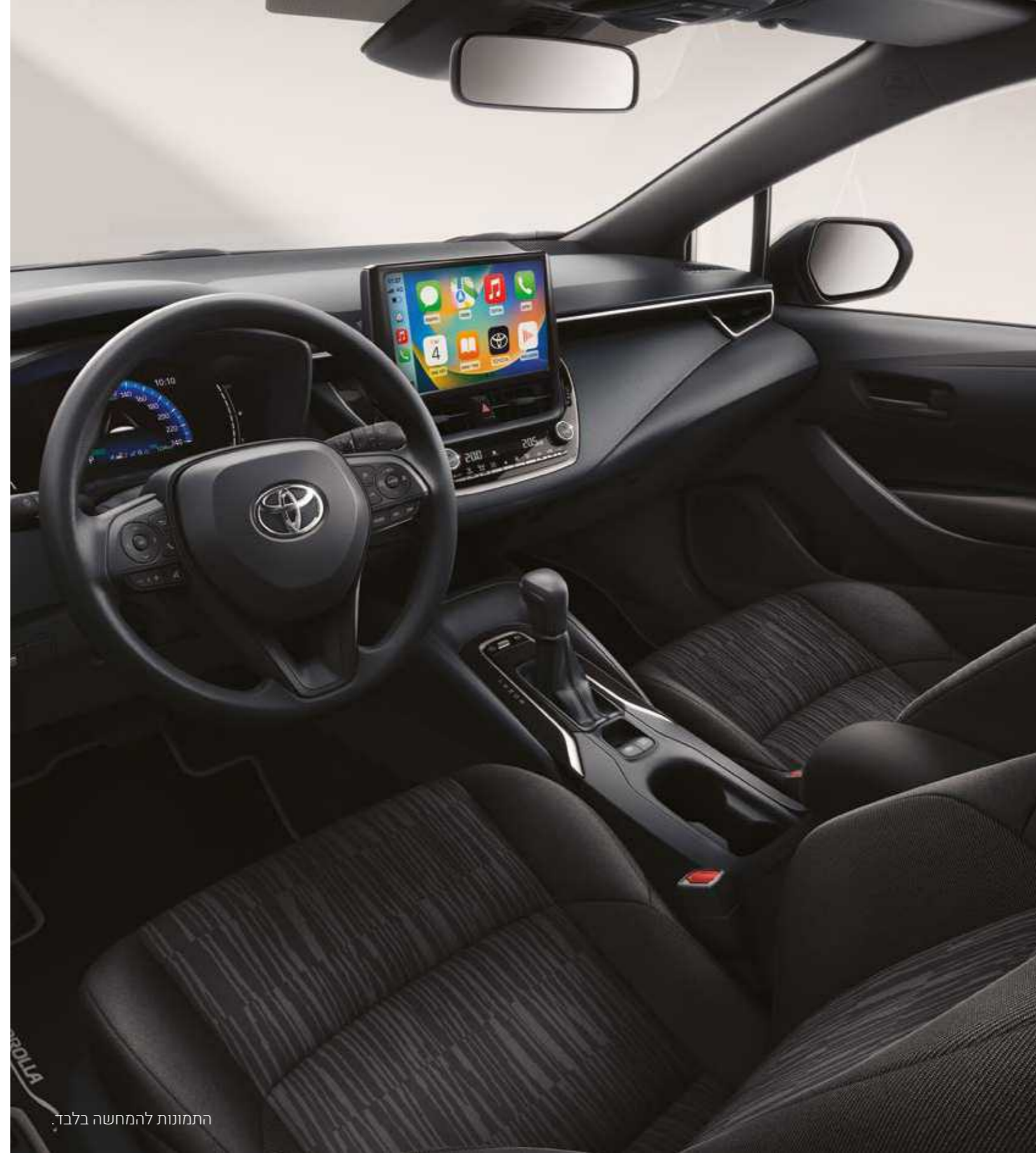
התמונות להמחשה בלבד.

*נכון למועד פרסום קטלוג זה, אפליקציית Android Auto אינה זמינה בישראל. **מומלץ לבדוק את תאימות הטלפון הנייד שברשותך למערכת ה-Bluetooth המותקנת ב-COROLLA, אשר הינה מסוג: Toyota Touch 2. את הבדיקה ניתן לעשות בלינק הבא: www.toyota-tech.eu/bluetooth/search.aspx