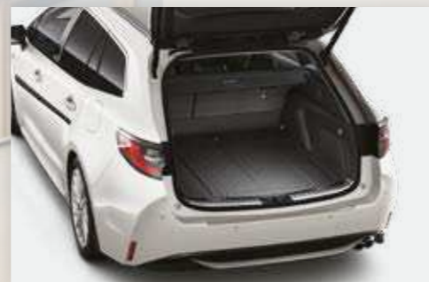
משטח הגנה לתא המטען