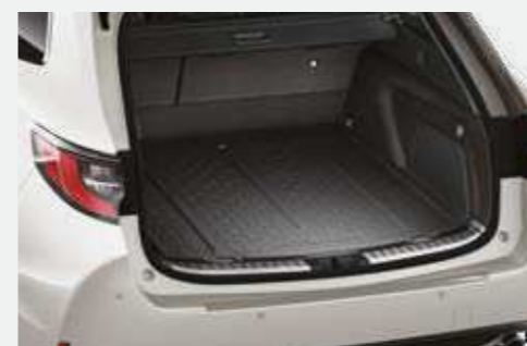
משטח הגנה לתא המטען המספק הגנה מפני לכלוך ומפני החלקה של ציוד וסחורה