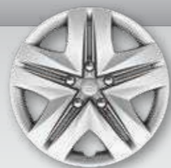
חישוקי פלדה 16" עם צלחות כיסוי מהודרות