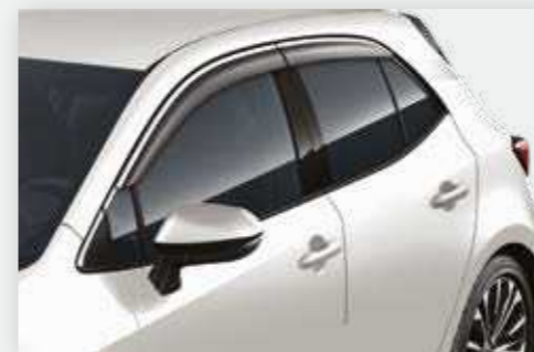
סט מגיני רוח