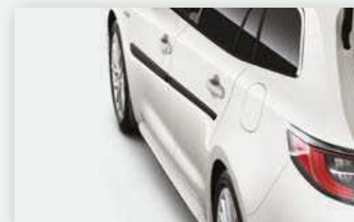
פסי הגנה לדלתות אשר יספקו הגנה מקיפה יותר לרכב שלך