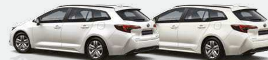
לבן פנינה מטאלי 089

*ממלך לבדוק את תאימות הטלפון הנייד שברשותך למערכת ה-Bluetooth המותקנת ב-COROLLA, אשר הינה מסוג Toyota Touch 2. את הבדיקה ניתן לעשות בלינק הבא: www.toyota-tech.eu/bluetooth/search.aspx . **נכון למועד פרסום קטלוג זה, אפליקציית Android Auto אינה זמינה בישראל. ***פעילות ה-E-Call תלויה ברשת הסלולרית הנמצאת בקרבת הרכב בעת שידור המידע