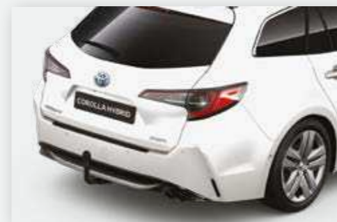
וו גרירה קבוע