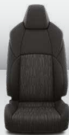
ריפוד בד שחור