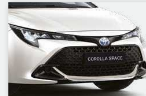
מגן פגוש קדמי שיגרום לרכב שלכם ולכם לבלוט בכביש בניקל, שחור או אדום