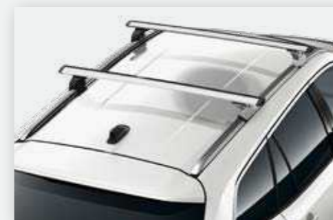
הוסיפו מוטות רוחב, עבור מגוון אביזרי גג ומתקני אופניים