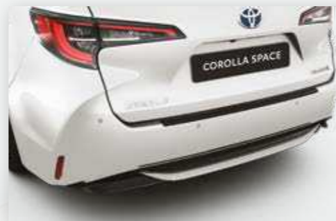
חיישני חניה אחוריים