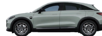
Future Green Metallic