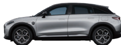
Cyber Silver Metallic