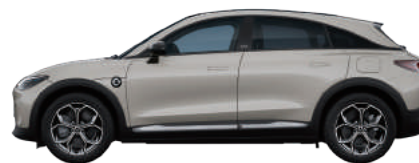
Ceramic Cream Solid