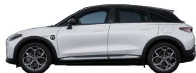
Digital White Metallic