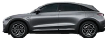
Atom Grey Matte