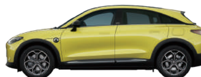
Lumen Yellow Solid