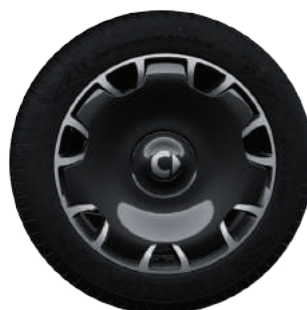
25th Anniversary Edition