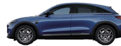
Quantum Blue Metallic