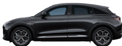
Meta Black Metallic