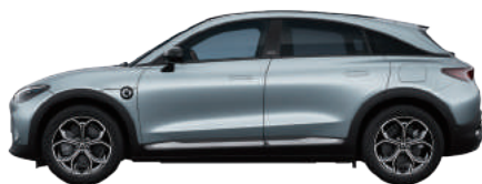
Electron Blue Matte