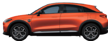
Photon Orange Metallic