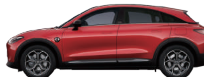
Leaser Red Metallic