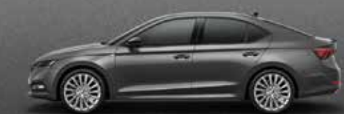
Graphite grey metallic