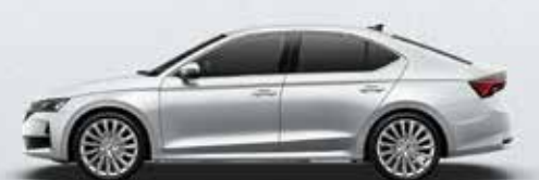
Moon White metallic