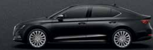
Magic Black metallic