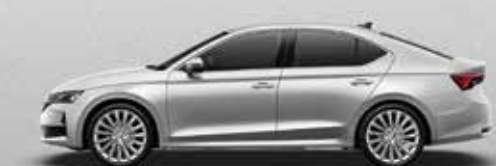
Brilliant Silver metallic