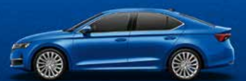
Race Blue metallic