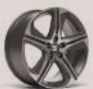
חישוק לאון FR מנוע 2.0