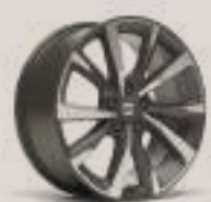
חישוק לאון FR מנוע 1.5