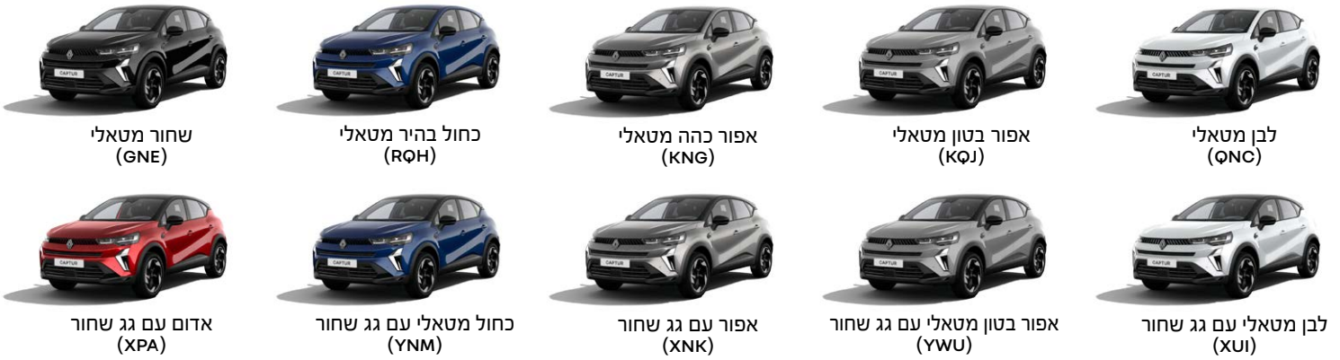
שחור מטאלי (GNE)