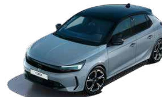
אפור בטון | Concrete Grey