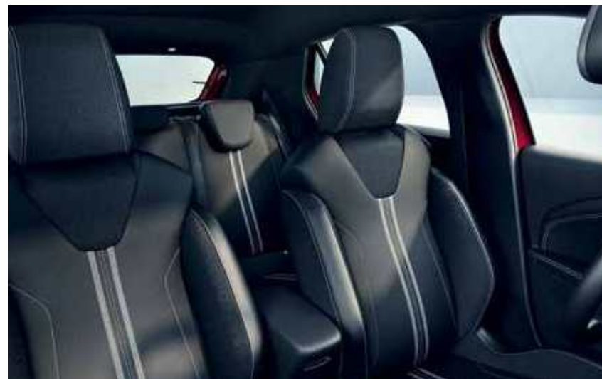
ריפוד משולב בד ועור מלאכותי בצבע שחור עם פס אפור GS