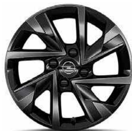
חישוקי סגסוגת 16" EDITION