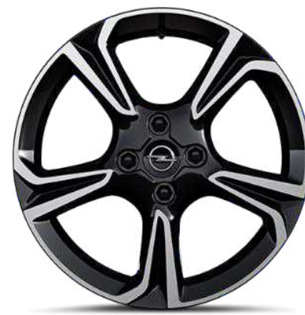
חישוקי סגסוגת 17" GS