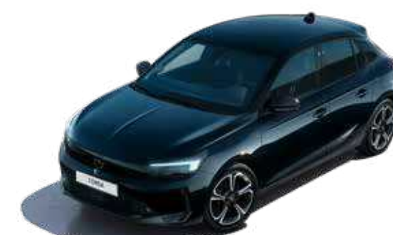
שחור מטאלי | Black Perla