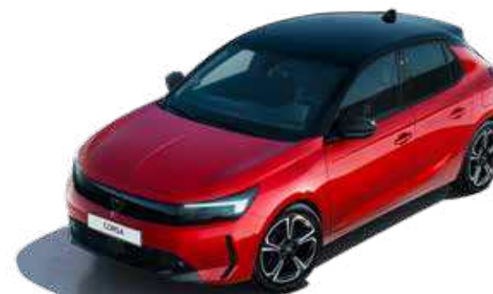
אדום מטאלי | Chili Red