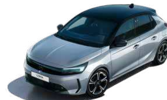
כסף מטאלי | Aluminium Grey