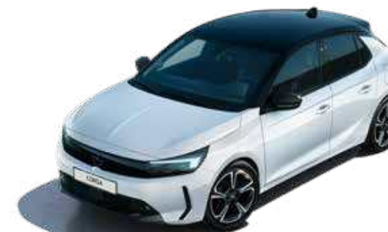
לבן בנקיז | Polar White