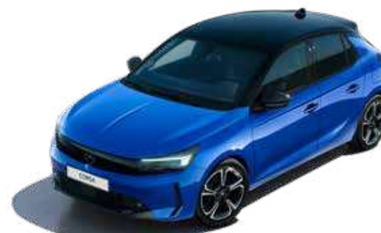
כחול מטאלי | Volatic Blue