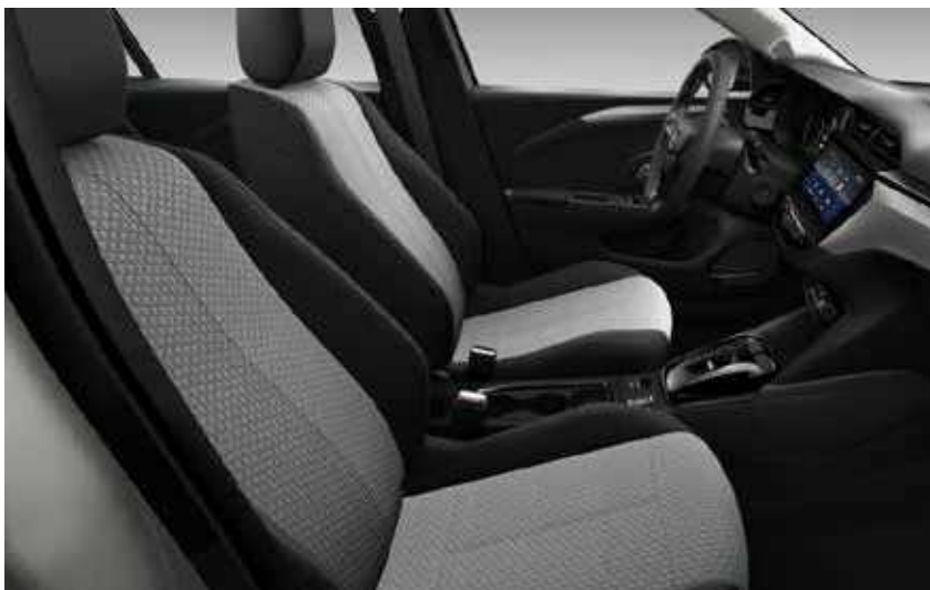
מושבים בריפוד בד בגווני אפור-שחור EDITION