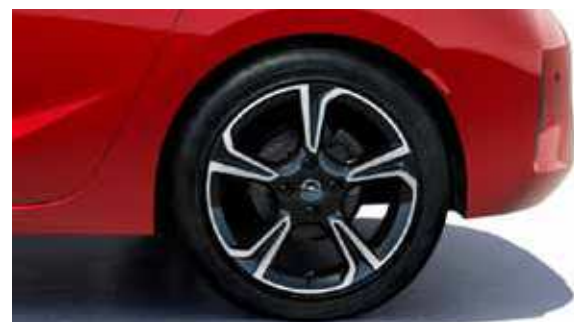
התמונות להמחשה בלבד.