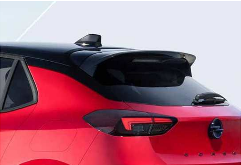
התמונה להמחשה בלבד.

*המערכת כוללת עדכונים ללא עלות לשלוש שנים. מערכת הניווט המותקנת ברכבך מספקת את השירות והתכנים הכלולים בה לשימוש "AS IS" בהתאם להגדרות היצרן ובכפוף לזמינות באזור הגאוגרפי. כמו כן, המערכת אינה מתריעה בזמן הניווט על סכנה לכניסה לאיזורים האסורים לכניסת ישראלים. השימוש במערכת על אחריות המשתמש בלבד.