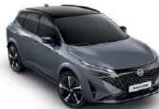
אפור פנינה מטאלי עם גג שחור (XEX)