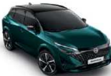
כחול אוקיינוס מטאלי עם גג שחור (XAH)