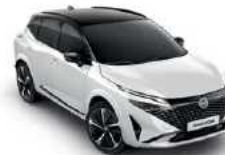
לבן פנינה מטאלי עם גג שחור (XKJ)