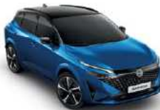
כחול רויאל מטאלי עם גג שחור (XGZ)