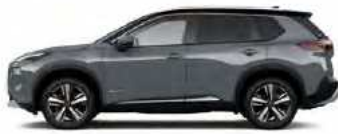
אפור פנינה מטאלי/גג שחור