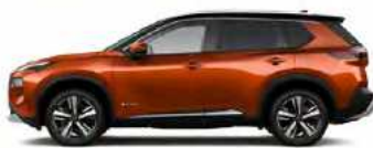
כתום מטאלי/גג שחור