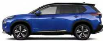
כחול ים מטאלי/גג שחור