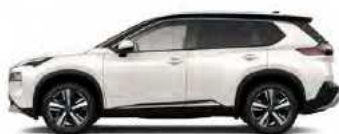
לבן פנינה מטאלי/גג שחור