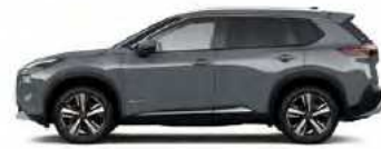
אפור פנינה מטאלי