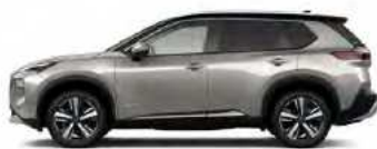
שמפניה מטאלי/גג שחור