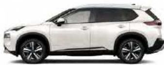
לבן פנינה מטאלי