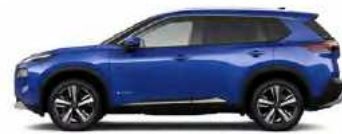
כחול ים מטאלי