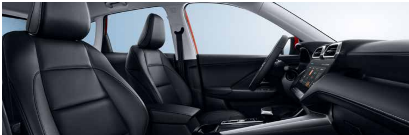
מושבים בריפוד עור מלאכותי בצבע שחור