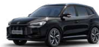
שחור מטאלי ●