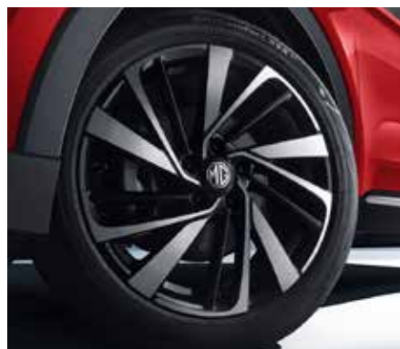
חישוק סגסוגת 18"