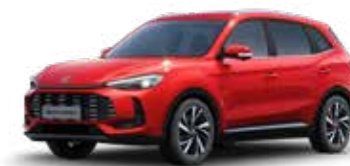
אדום מטאלי ●