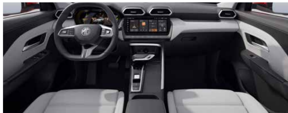
מושבים בריפוד עור מלאכותי בגוון בהיר (בתוספת תשלום)