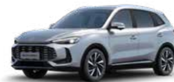
כסוף מטאלי ●