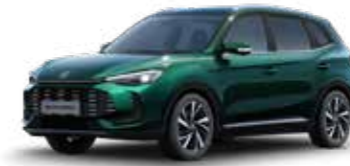
ירוק מטאלי ●