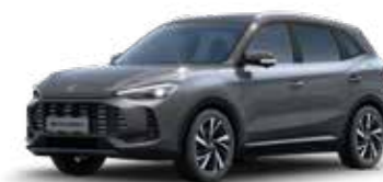
אפור מטאלי ●