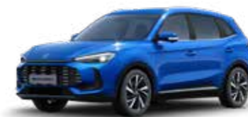
כחול מטאלי ●