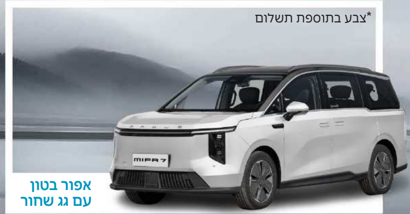
*צבע בתוספת תשלום