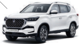
Silky White Pearl (WAK)