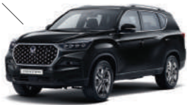
Space Black (LAK)