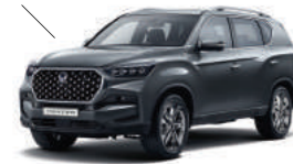
Marble Gray (ACM)