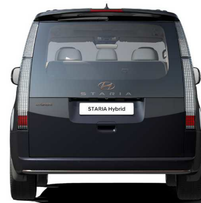
פנסים אחוריים מסוג LED עם פיקסלים משתנים*