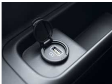
4 שקעי USB*