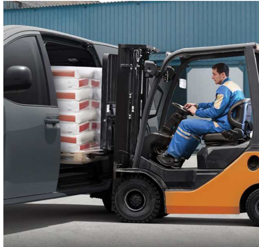
תא מטען מרווח

העיצוב השימושי כולל קונסולת אחסון מרכזית מתקפלת אשר הופכת למושב נוסע שלישי בעת פתיחתה. כריות התמיכה הצדדיות של המושב ומשענות היד המרכזיות המתכווננות מספקות נוחות ותמיכה.