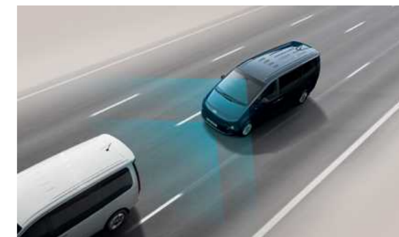
בלימה אוטונומית במצבי חירום (FCA-JX) הכוללת זיהוי כלי רכב, הולכי רגל, דו-גלגלי ופניה בצומת.

16 / התמונות להמחשה בלבד. / *בחלק מהדגמים.