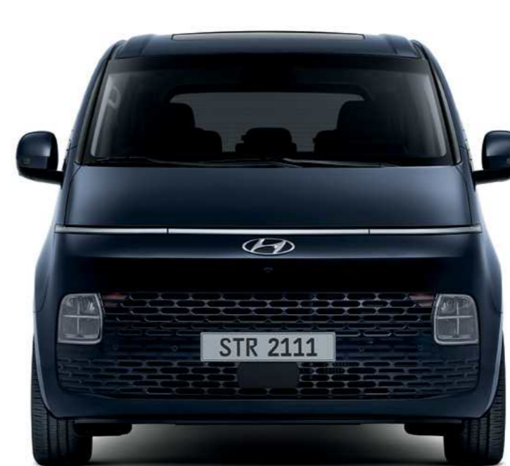
פנסים קדמיים מסוג LED*

כבר מהמבט ראשון, ברור שיונדאי STARIA Hybrid היא יצירה מקורית אמיתית. מבחוץ, העיצוב מעורר השראה עם העיניים קדימה. בפנים, ממתין לכם תא נוסעים עצום, פתוח ורחב, עם חומרים אלגנטיים רכים ונעימים למגע וסביבת נהג עשירה במאפיינים יוקרתיים.