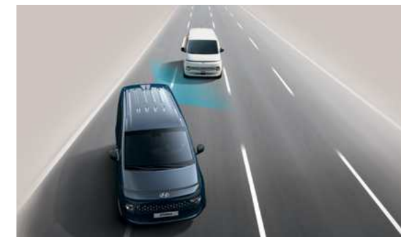
מערכת אקטיבית לזיהוי ומניעת התנגשות בכלי רכב ב"שטח מת" (BCA)* מערכת אקטיבית למניעת התנגשות בעת מעבר נתיב המספקת התרעה על רכב ב"שטח מת".