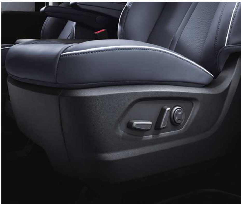
מושב נהג חשמלי*

ליונדאי STARIA Hybrid שפע תאי אחסון ומאפייני נוחות שימושיים בחלל הפנימי, כגון מערכת המולטימדיה המתקדמת ומערך מצלמות היקפיות*. למכונית מתקדמת מגיע אבזור מתקדם.