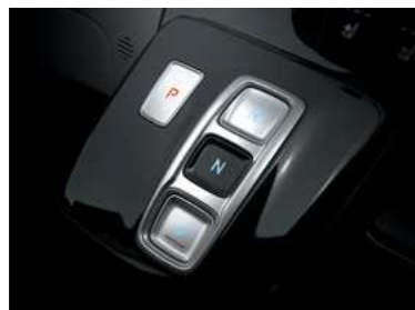
SBW (Shift By Wire) בחירת הילוך נסיעה בכפתור