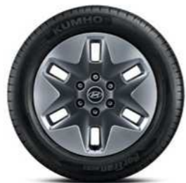
חישוקי סגסוגת 18"