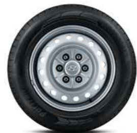
חישוקי ברזל 17 (דגם מסחרי סגור בלבד)