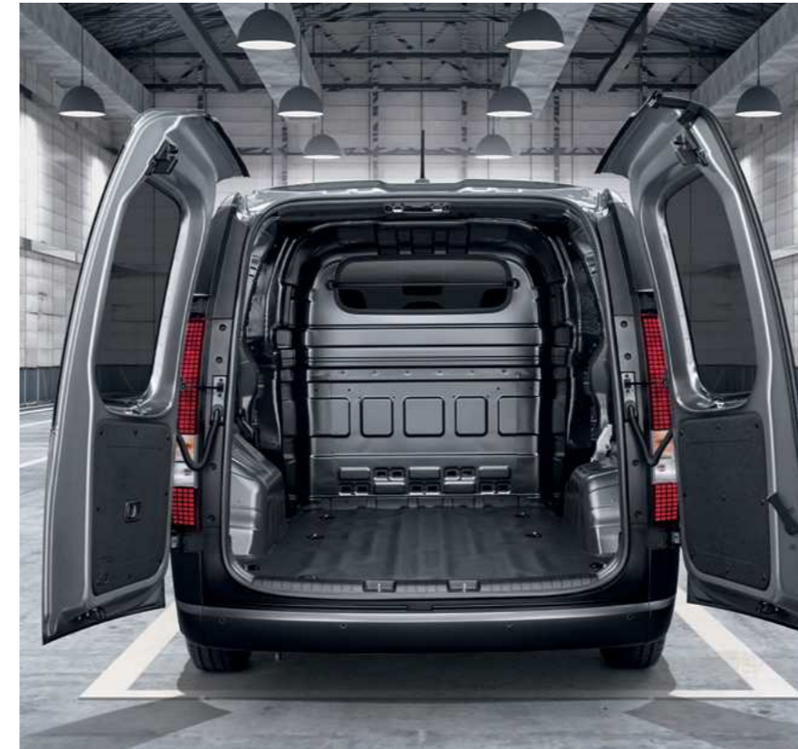
דלת תא מטען כפולה הנפתחת לצדדים ומשטח הטענה באורך 2.5 מטר

תא המטען של יונדאי סטאריה מרשים בגודלו וגמיש במיוחד: ניתן להעמיס את המטען במהירות ובקלות דרך דלת הזזה ברוחב של 870 מ"מ או דרך דלת תא המטען האחורית.