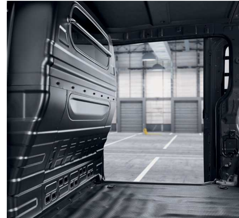
מחיצה בין תא הנוסעים ותא המטען