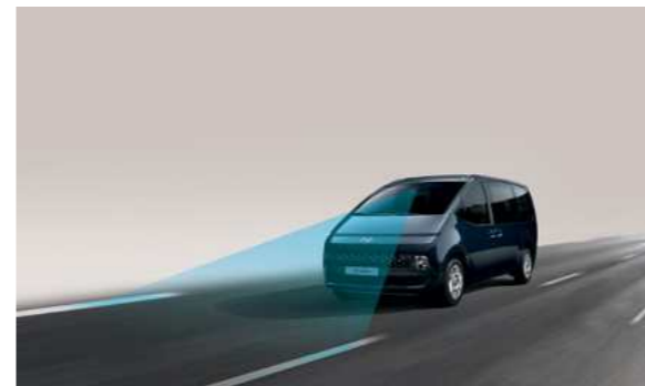
מערכת אקטיבית הכוללת תיקון הגה לשמירה על נתיב הנסיעה (LKA) מערכת אקטיבית הכוללת תיקון הגה לסיוע בשמירה על נתיב הנסיעה.