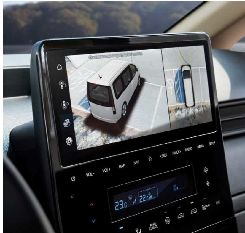
מערך מצלמות היקפיות (SVM)* יונדאי סטאריה ההיברידיה מצוידת במערך 4 מצלמות היקפיות.