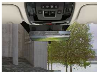
מראה מרכזית מתכהה אוטומטית*