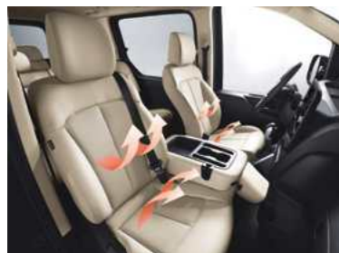
חימום מושבים קדמיים*