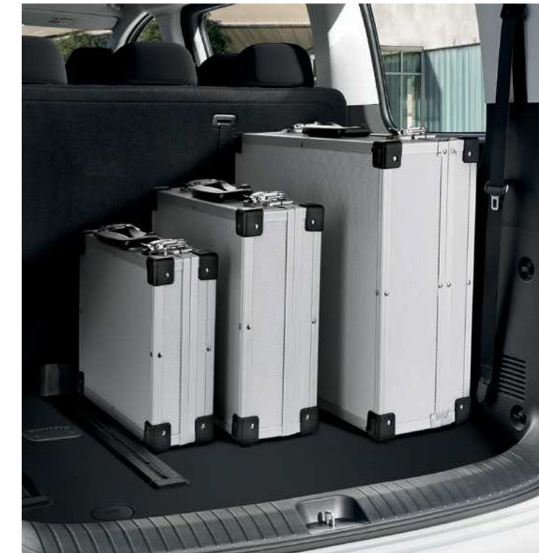
תא מטען מרווח תא המטען בנפח של עד 1,303 ל' (בהזזת המושבים קדימה) יאפשר לכם להכניס בנוחות את כל הציוד הנדרש לכם, למשפחה ולכלל הנוסעים.