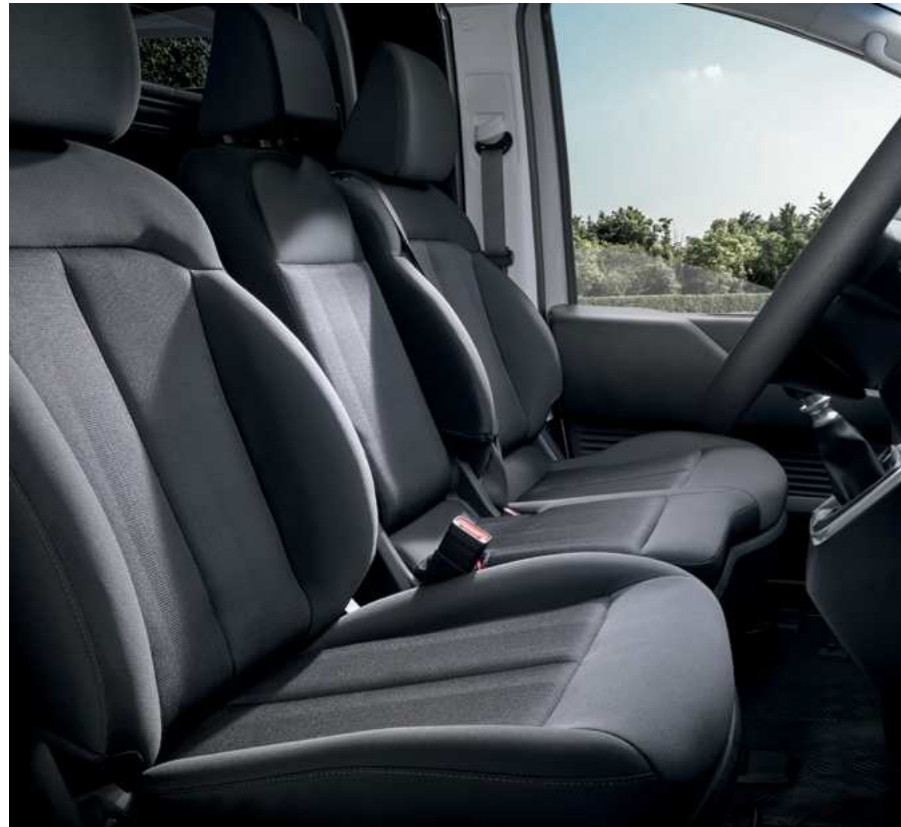
תא נוסעים שלושה מושבים

גרסת המסחרית של יונדאי STARIA Hybrid המציעה חלל מטען בנפח עצום של 4,935 ליטרים, משלבת בין יכולת הובלה מקסימלית ורמות נוחות ללא פשרות ומציעה רכב מסחרי יעודי להובלה שאי אפשר להתעלם ממנו. גרסה אידיאלית לכל איש מקצוע ולנהגים מקצועיים הדורשים יעילות מקסימלית.