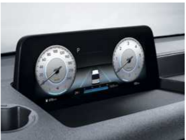
לוח מחוונים דיגיטלי 10.25