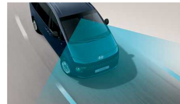
מערכת סיוע לשמירה על מרכז נתיב הנסיעה (LFA) מערכת אקטיבית המסייעת בשמירה על מרכז נתיב הנסיעה.