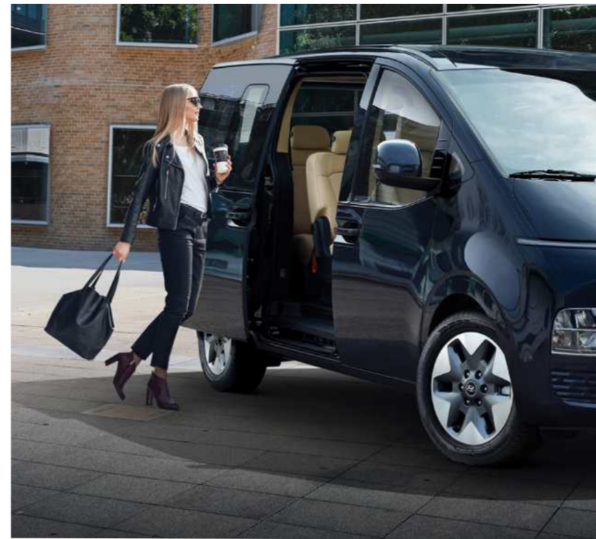
מפתח רחב הדלתות מעוצבות בצורה המאפשרת כניסה ויציאה נוחה ונינוחה במיוחד.