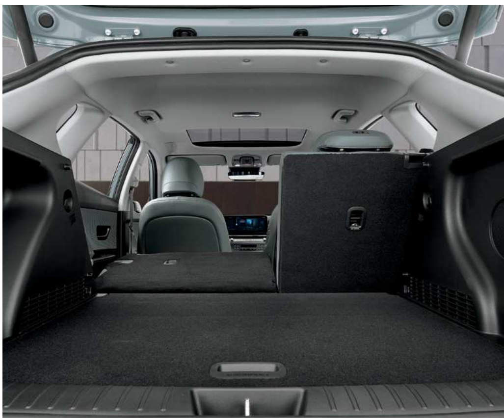
משענות גב אחוריות מתקפלות

ל-KONA חלל פנים פרקטי ומרווח המתמקד בנוחות הנוסעים מאחור, ובתא מטען גדול המתאים למגוון סגנונות חיים.