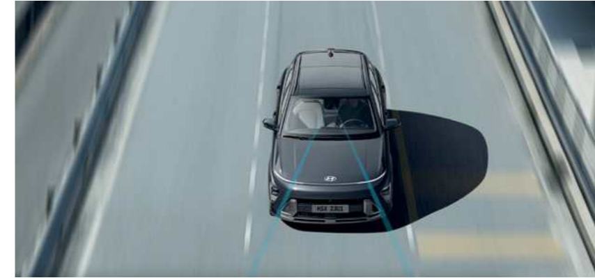
מערכת אקטיבית הכוללת תיקון הגה (LKA) מערכת אקטיבית הכוללת תיקון הגה לסיוע בשמירה על נתיב הנסיעה. כאשר המערכת מזהה סטייה מנתיב הנסיעה, היא מבצעת תיקון הגה אוטומטי בכדי למנוע את הסטייה מנתיב הנסיעה.