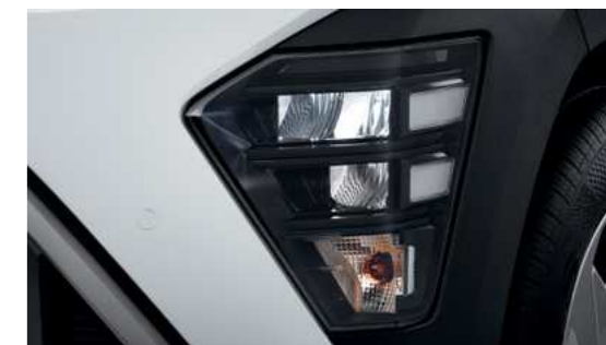
תאורה ראשית מסוג LED