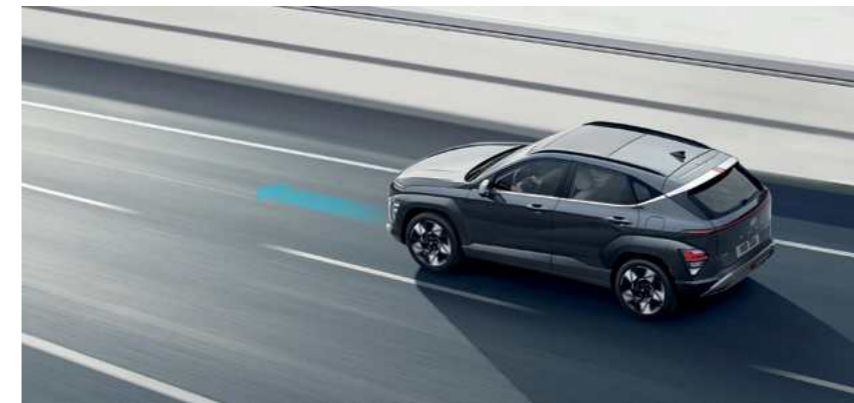
מערכת סיוע לשמירה על מרכז נתיב הנסיעה (LFA) מערכת אקטיבית המסייעת בשמירה על מרכז נתיב הנסיעה.