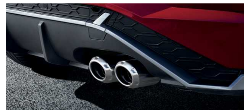
צינור מפלט כפול בעיצוב N Line