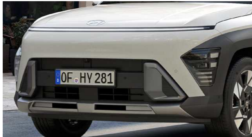
חזית קדמית אגרסיבית בחתימה העיצובית החדשה של יונדאי