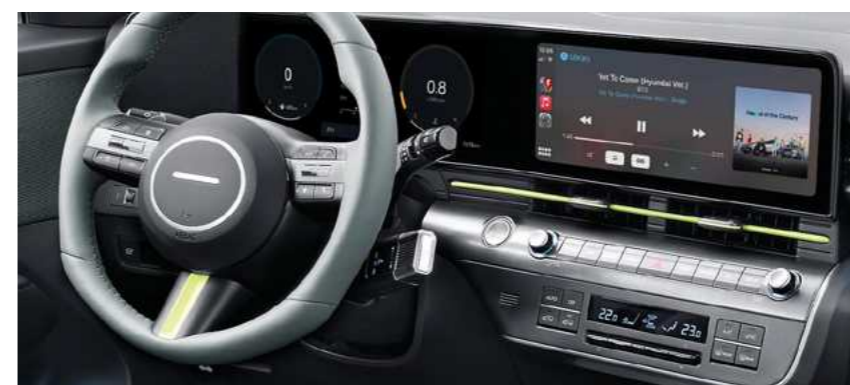
מערכת מולטימדיה מקורית 12.3" עם אפשרות חיבור ל- Apple CarPlay ו- Android Auto*