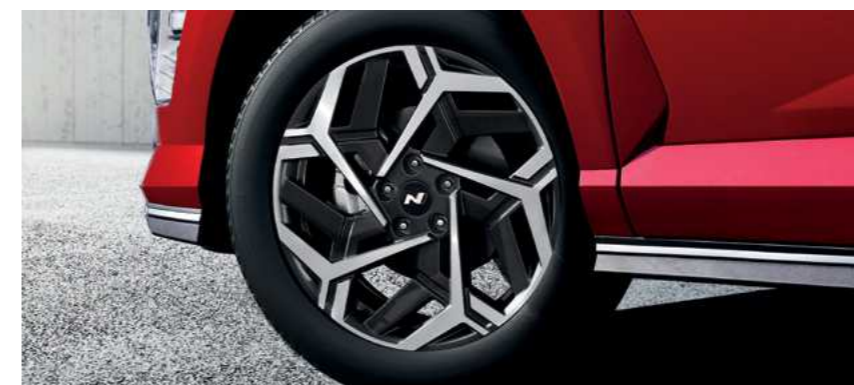
חישוקי סגסוגת קלה 18"