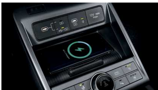
שקעי טעינה/נתונים מסוג USB-C משטח טעינה אלחוטי לנייד**