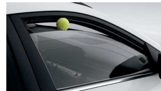
חלון חשמלי בטיחותי