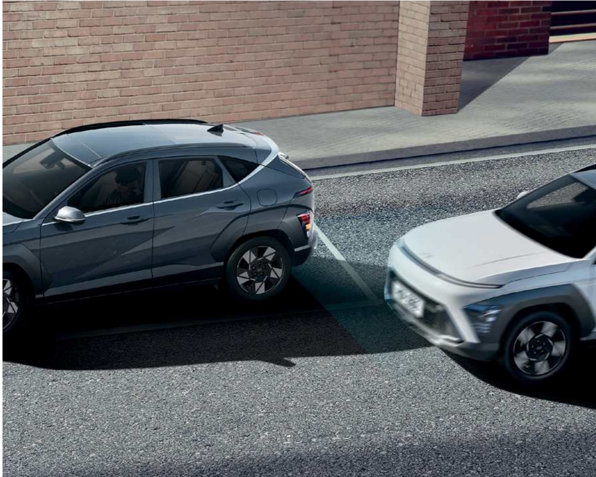
מערכת אקטיבית לזיהוי ומניעת התנגשות בכלי רכב ב"שטח מת" (BCA)* מערכת מבוססת רדאר המתריעה על רכבים ב"שטח מת" בעת מעבר נתיב ומבצעת תיקון הגה אוטומטי במידה והנתיב אינו פנוי.