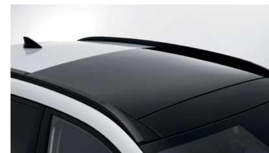
גג שמש נפתח*