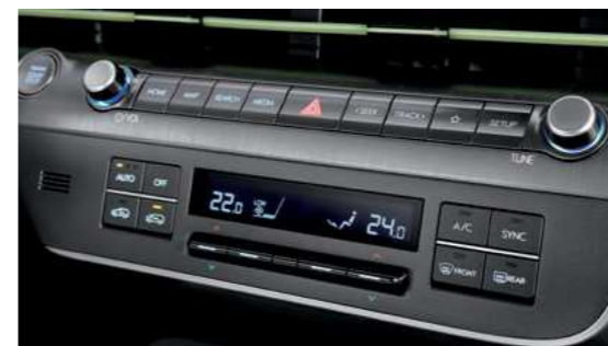
מערכת בקרת אקלים דיגיטלית מפוצלת