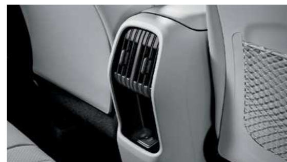
פתחי מיזוג אוויר למושב האחורי