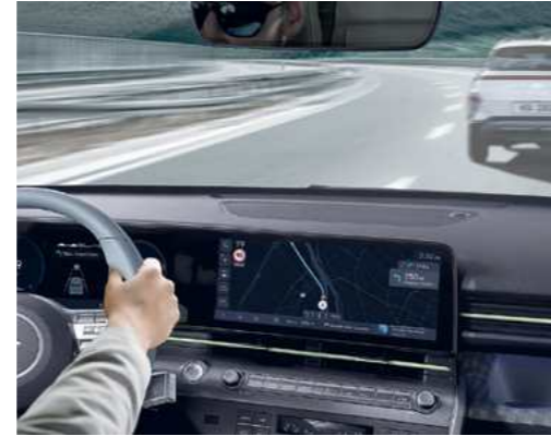
בקרת שיוט חכמה (SCC) שומרת על מהירות ומרחק קבועים מהרכב שמלפנים בעזרת חיישן רדאר ושולטת בהאצה והאטת הרכב באופן אוטונומי עד עצירה מוחלטת*.