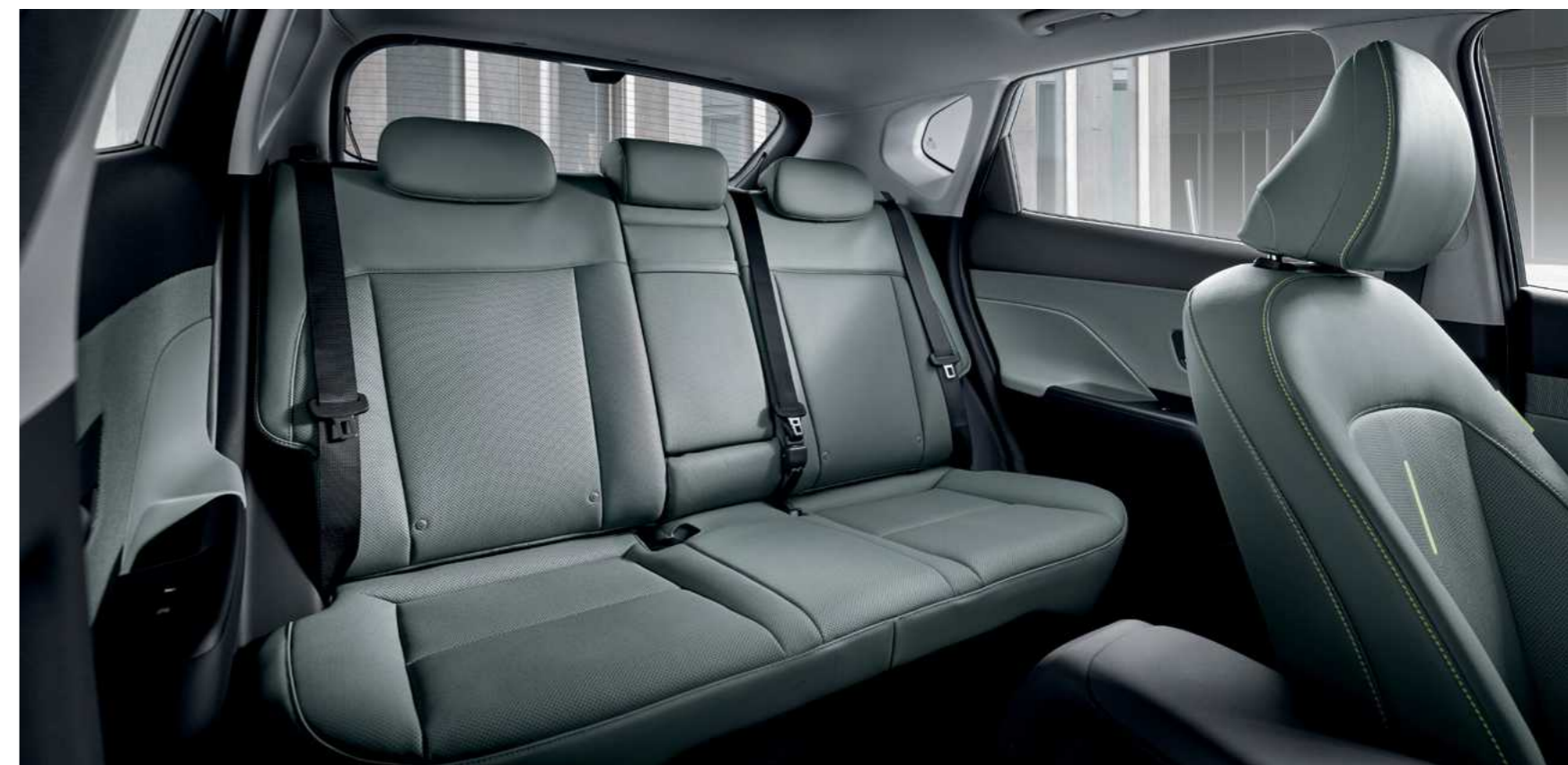
שורת מושבים שנייה מרווחת