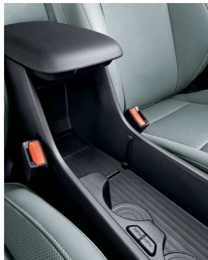
קונסולה פתוחה (מחיצה הניתנת להסרה/מחזיקי כוסות מסתובבים)