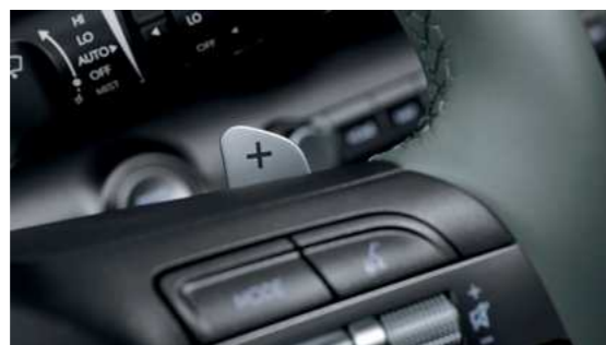
מנופי שליטה בבלימה רגנרטיבית