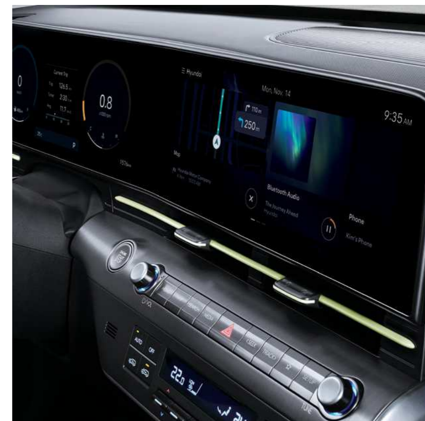
מסך כפול בגודל 12.3"