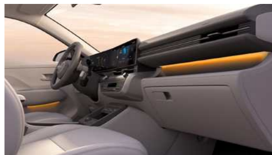
תאורת אווירה ב-64 גוונים משתנים*