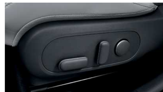
מושב נהג עם אפשרות כוונן חשמלי*