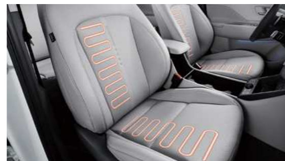
מושבים קדמיים מחוממים*