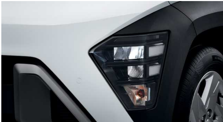
תאורה ראשית מסוג LED

החרטום הנקי של ה-KONA מדגיש את הביצועים האווירודינמיים ואת העוצמה הטהורה שלה. קו האופי הדינמי יוצר אפקט מרשים אל מול קווי המתאר הפנורמיים שלה.