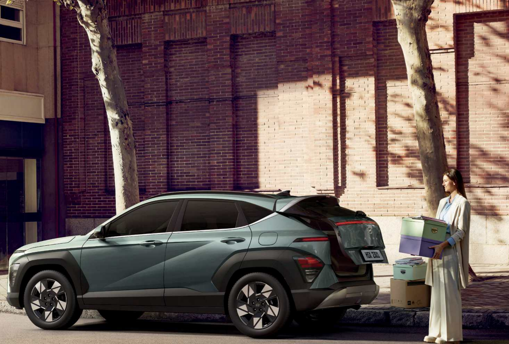
דלת תא מטען חשמלית חכמה - הפעלה חכמה ללא מגע, עם פתיחה אוטומטית וכוונון גובה (בחלק מהדגמים).

המסך הפנורמי - מסך כפול בגודל 12.3" וטכנולוגיית מערכות העזר המתקדמות לנהג, מציעים נוחות ברמה גבוהה ושימושיות יום-יומית מעולה.