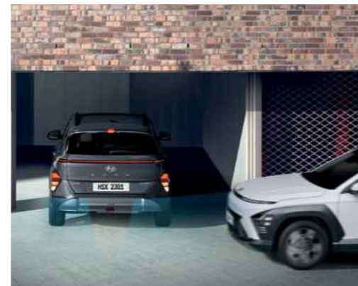
התרעה ומניעת פגיעה ברכב חוצה מאחור (RCCA)* מערכת אקטיבית למניעת פגיעה ברכב חוצה בעת נסיעה לאחור.