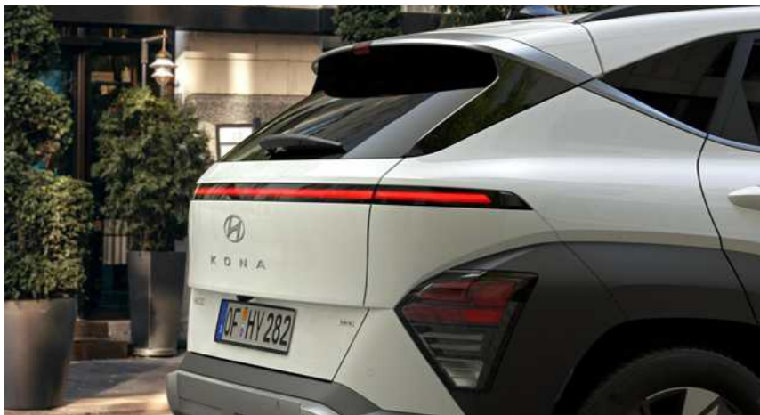
ספוילר אינטגרלי, פנס אופקי אחורי, פנסי בלימה + איתות מסוג LED