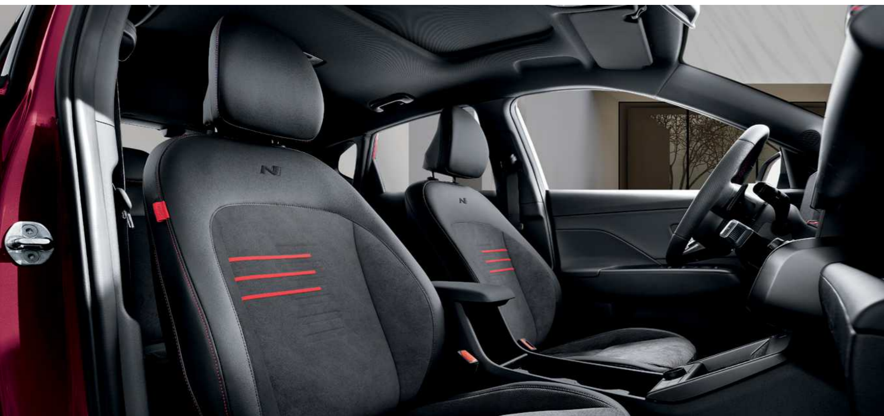
מושבים בגימור אלקנטרה / עור בעיצוב N Line

גרסת ה-N Line מתאפיינת בעיצוב חיצוני בולט, דינמי ועתיר ביצועים בהשראת חטיבת הביצועים N.