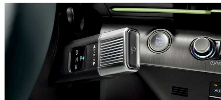
בורר הילוכים אלקטרוני על מוט ההגה (SBW)