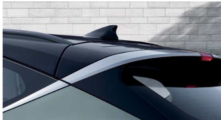
צביעה דו גוונית, אנטנת סנפיר*