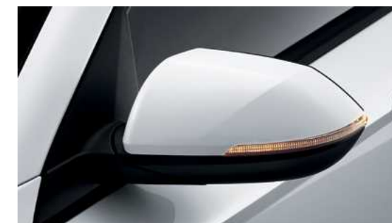
פנסי איתות במראות הצד