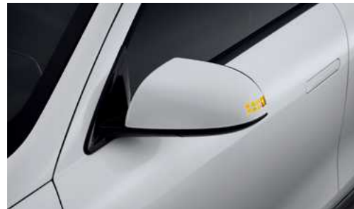
איתות במראות צד