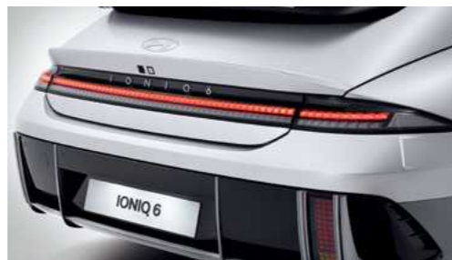
פנסים אחוריים בתאורת LED