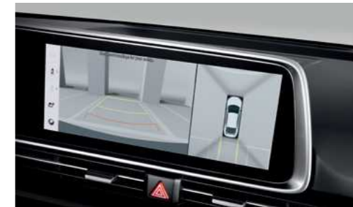
מערך 4 מצלמות היקפי (AVM)*