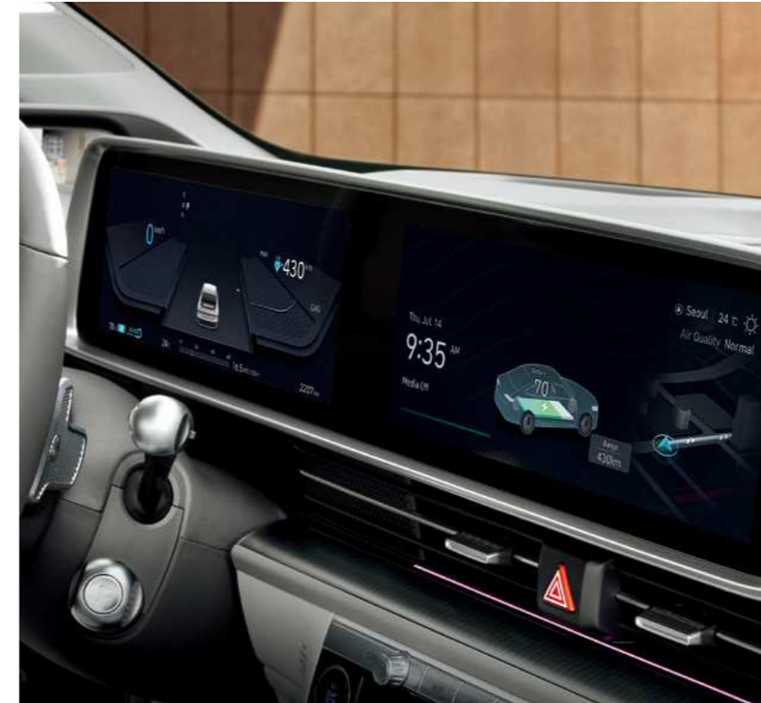
תצוגה רחבה אינטגרלית

לנוחות הנוסעים מאחור, פתחי מיזוג אוויר למושב האחורי בשילוב שני שקעי USB type C.