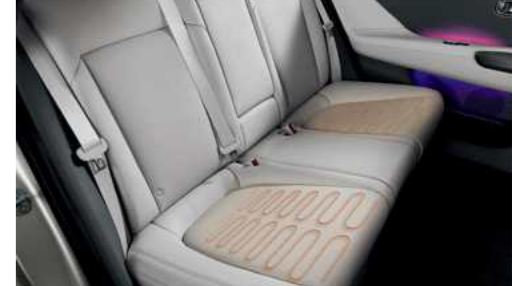
חימום מושבים אחוריים*