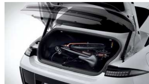
דלת תא מטען חשמלית