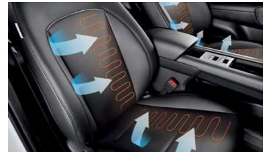
חימום מושבים קדמיים