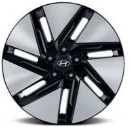
חישוקי סגסוגת בקוטר 18"