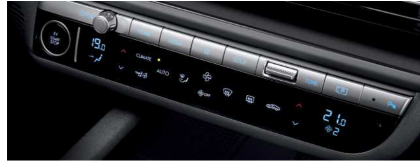
מערכת בקרת אקלים דיגיטלית מכוזלת

מערכת בקרת האקלים מצוידת במערכת דו-אזורית המאפשרת שליטה מדויקת בטמפרטורה.