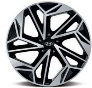
חישוקי סגסוגת בקוטר 20"