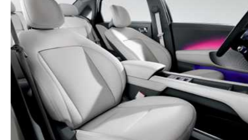
מושבים קדמיים מתכווננים הניתנים להטיה מלאה*