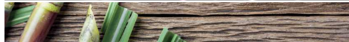
דשבורד BIO-TPO תרכובת ייחודית המכילה רכיבים טבעיים ועושה שימוש בסיבי קני סוכר המשמשת ליצירת דשבורד מודרני, איכותי וידידותי לסביבה.