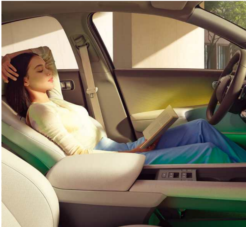
מושבים קדמיים מתכוננים הניתנים להטיה מלאה (Relaxation Comfort Seat)**

גלו את המגוון הרחב של מאפייני הנוחות ב-IONIQ 6.