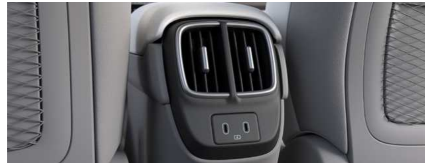
פתחי מיזוג אוויר למושב האחורי

מערכת בקרת האקלים מצוידת במערכת דו-אזורית המאפשרת שליטה מדויקת בטמפרטורה.