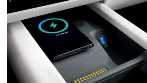
טעינה אלחוטית לנייד (למכשירים תומכים בטכנולוגיה לפי תקן טעינה qi)