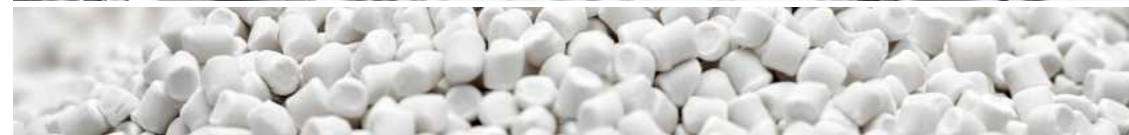
תקרת בד BIO-PET החומר המשמש לייצור התקרה מגיע מסיבים ידידותיים לסביבה המיוצרים מקני סוכר.