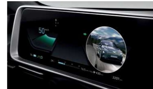
הצגת צילום חי של "שטח מת" על גבי לוח המחוונים הדיגיטלי בעת הפעלת איתות (BVM)*