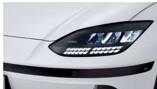
פנסים ראשיים + תאורת יום LED