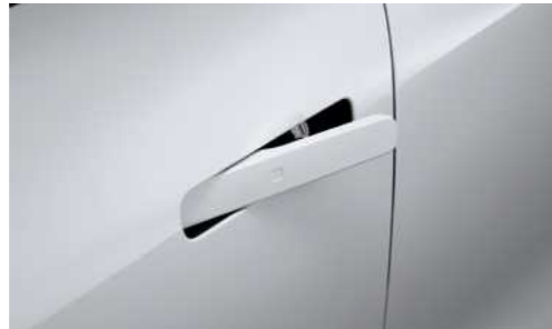
ידיות דלתות שטוחות