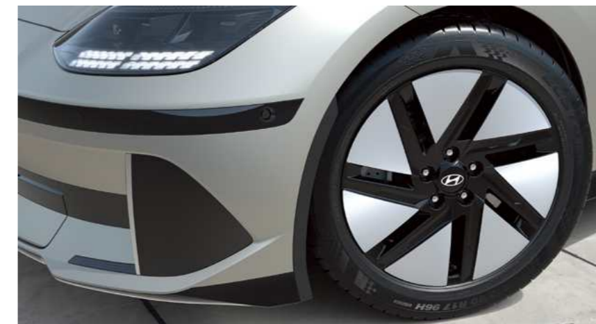
חישוקי סגסוגת בקוטר "18"