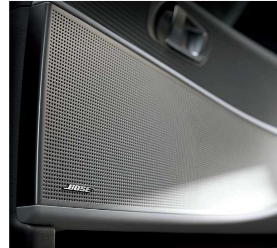
מערכת שמע יוקרתית מבית Bose*

לוח מחוונים בגודל 12.25" ומערכת מולטימדיה גם היא בגודל 12.25" יוצרים יחד מסך אחד רחב המספק גישה מהירה לכל המידע החיוני. כל מה שאתם צריכים, נמצא ממש בקצות אצבעותיכם.