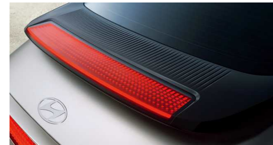
תאורת בלם אחורי בעיצוב פיקסל