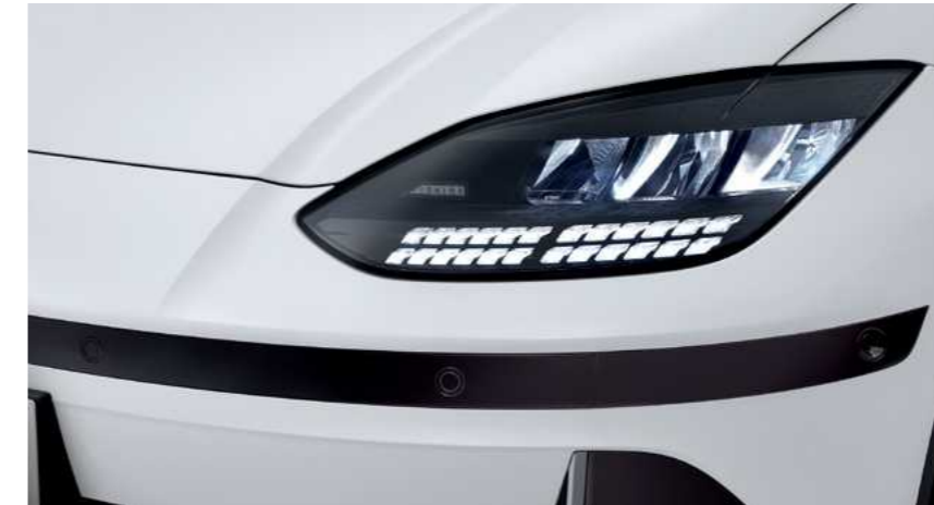
פנסים קדמיים מסוג LED בעיצוב פיקסלים