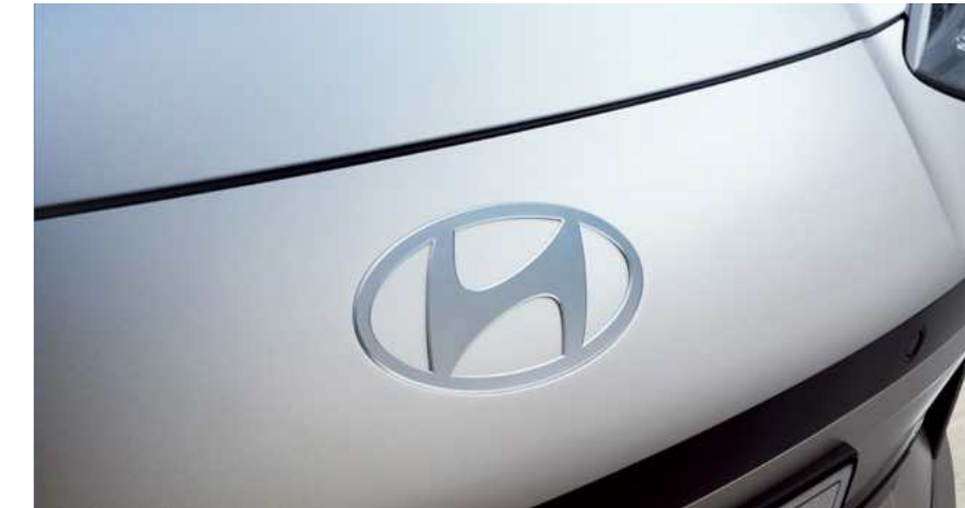
מכסה מנוע שטוח וסמל יונדאי בעיצוב חדש