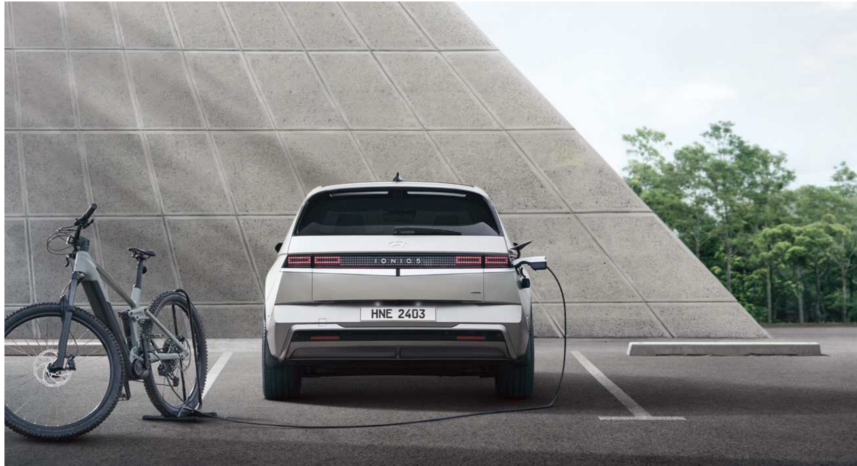
אפשרות לטעינה חיצונית של מוצרי חשמל V2L (אביזר בתוספת תשלום)

מגוון אלמנטים חדשניים ושימוש בטכנולוגיות חכמות ומתקדמות.