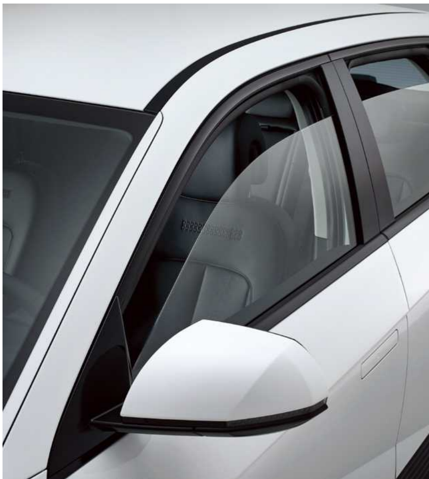
קיפול מראות חשמלי

כל מילימטר ב-IONIQ 5 טופל בקפידה, כולל פרטי הגלגלים, במטרה לחזק את העיצוב האייקוני ולשדרג את המאפיינים האווירודינמיים שלה.