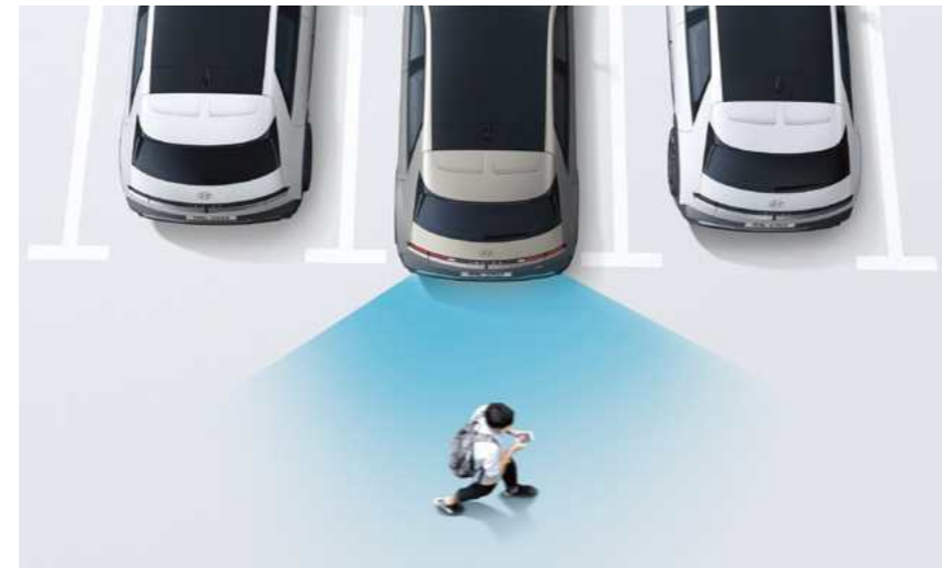
מערכת אקטיבית להתראה ומניעת התנגשות בעת כניסה ויציאה מחניה (PCA)*