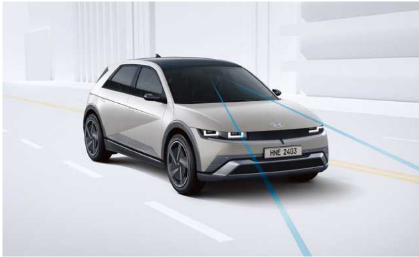
מערכת אקטיבית הכוללת תיקון הגה (LKA)

ליהנות ממערכות עזר וממערכות בטיחות ברמה הגבוהה ביותר. יונדאי IONIQ 5 צוידה במערכות הבטיחות ובמערכות העזר המתקדמות והחדישות ביותר כדי שתוכלו לנהוג בראש שקט.