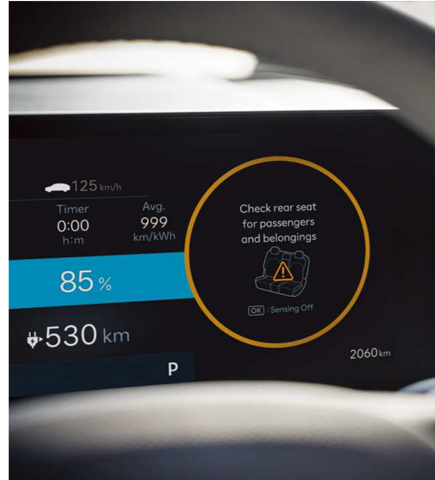
חיווי תזכורת על שיכחת ילד/נוסע במושב האחורי (ROA)