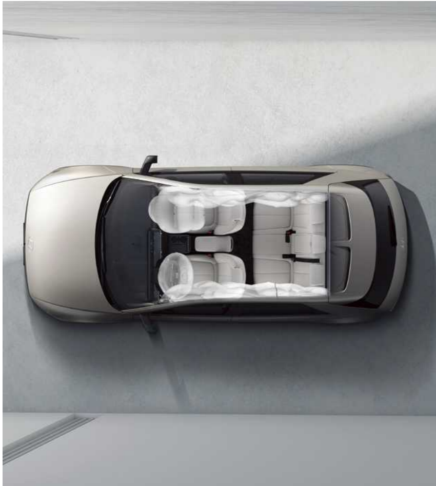
7 כריות אוויר

טכנולוגיות מתקדמות מספקות הגנה מרבית המאפשרת לכם ליהנות מחוויית נסיעה רגועה יותר ובטוחה יותר.