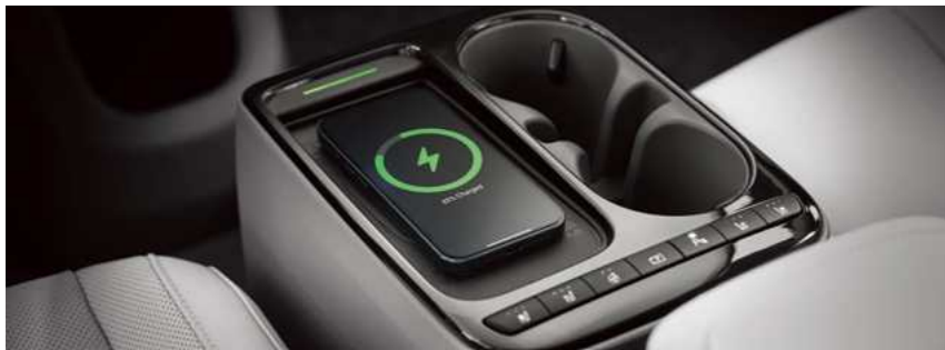
טעינה אלחוטית לנייד (לטלפונים התומכים בטכנולוגיית Qi)*