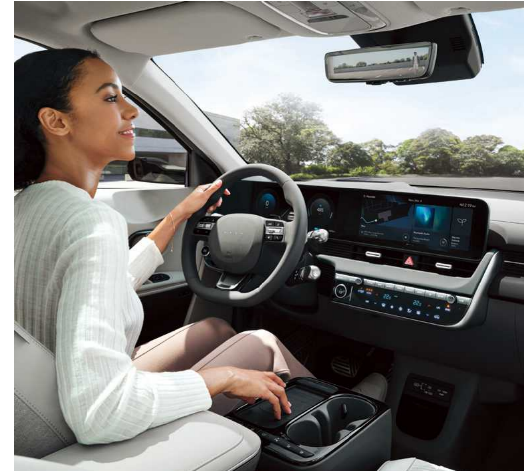
מראה מרכזית מתכהה נגד סינוור ECM*