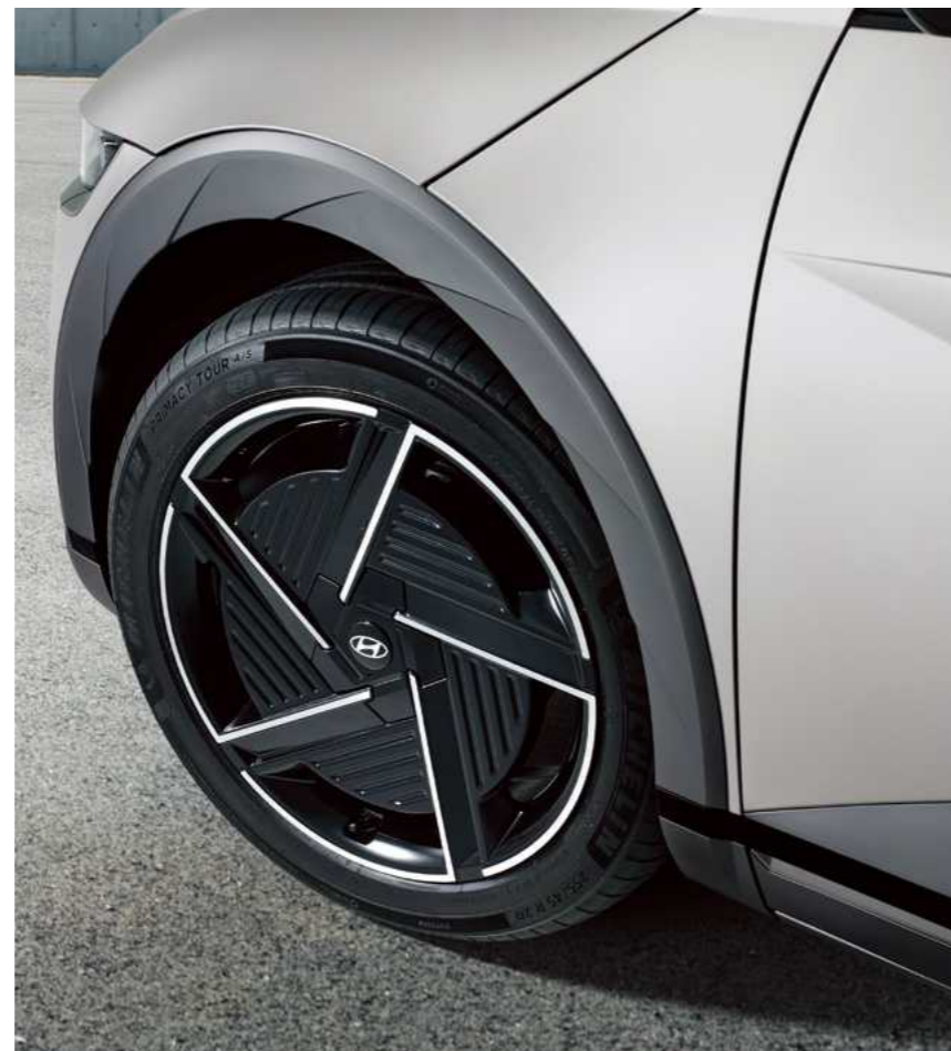
חישוקי סגסוגת 20"