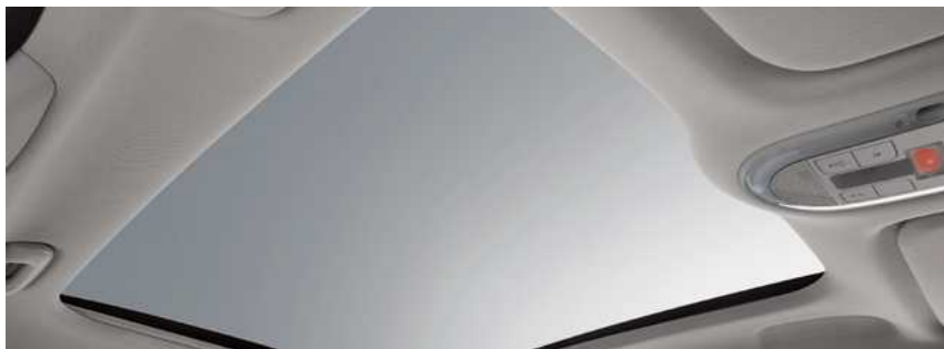
גג שמש פנורמי*