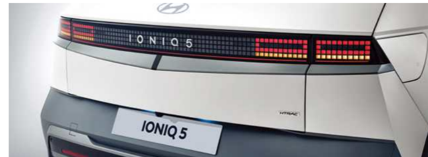
תאורת LED אחורית