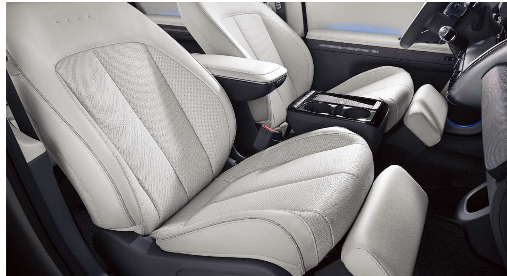
Relaxation Seat מושבים קדמיים מתכווננים הניתנים להטיה מלאה*