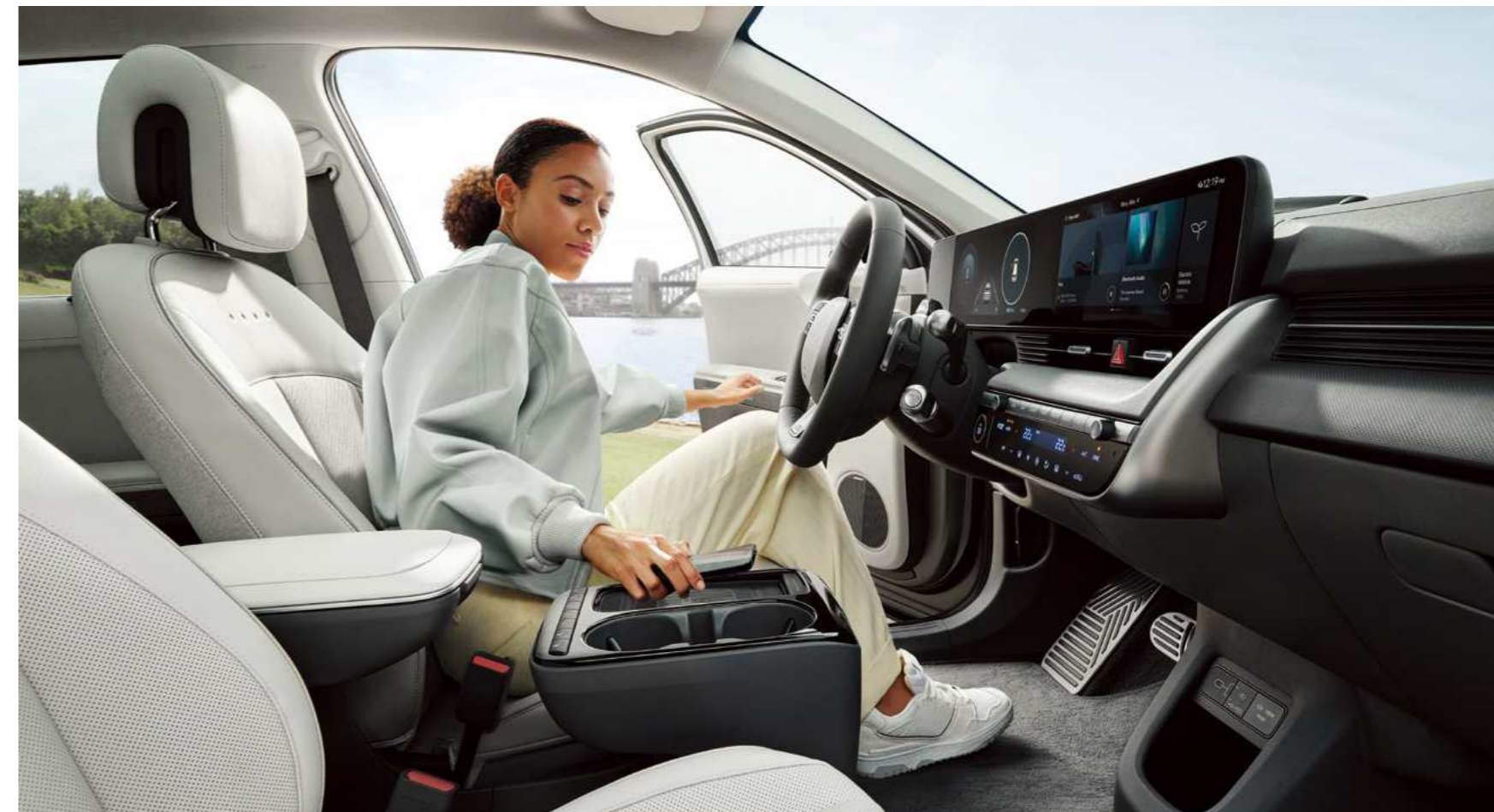
קונסולה מרכזית צפה הניתנת להזזה עד 14 ס"מ, בשילוב משטח טעינה אלחוטית** ולחצן לחימום ואוורור מושבים קדמיים*.