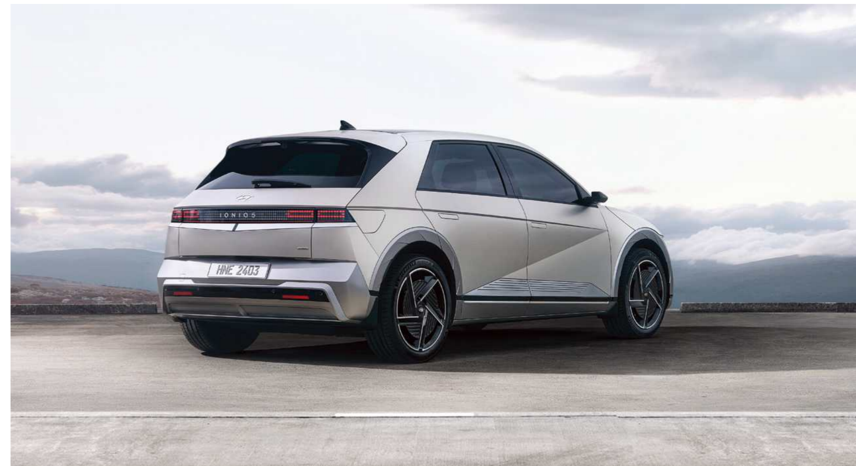
פגוש אחורי רחב בשילוב פנסים בטכנולוגיית LED

עיצוב הפגוש האחורי בשילוב פנסי ה-LED והספילר מעניקים ל-IONIQ 5 מראה חלק.