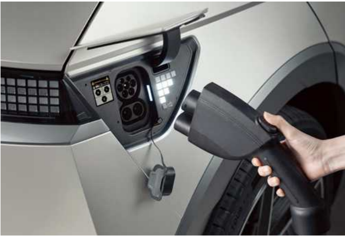
פתח טעינה חשמלית ותאורת פיקסלים המראה את מצב הסוללה

*בחלק מהדגמים / טווח הנסיעה וצריכת החשמל בפועל מושפעים, בין היתר, גם מתנאי הדרך, מתחזוקת הרכב, ממאפייני הנהיגה ומקיבולת ובלאי הסוללה, ועל כן הם יכולים להיות שונים בהשוואה לנתוני המעבדה. ** זמן הטעינה בפועל עשוי להיות שונה והוא תלוי בגורמים שונים ביניהם בין היתר נתוני עמדת הטעינה, תנאי הטמפרטורה ומצב טעינת הסוללה בפועל.