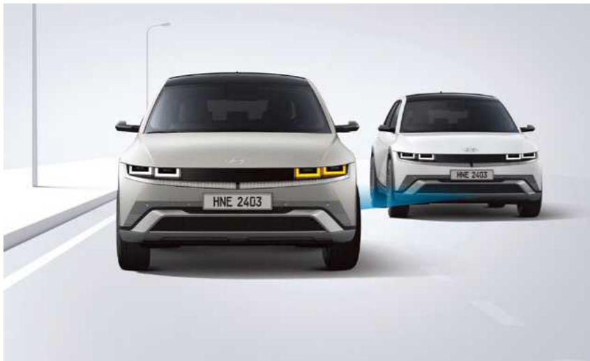
מערכת אקטיבית לזיהוי ומניעת התנגשות בכלי רכב ב"שטח מת" (BCA)

מערכת מבוססת רדאר המתריעה על רכבים ב"שטח מת" בעת מעבר נתיב ומבצעת תיקון הגה אוטומטי במידה והנתיב אינו פנוי.