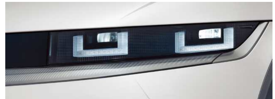
תאורת LED קדמית