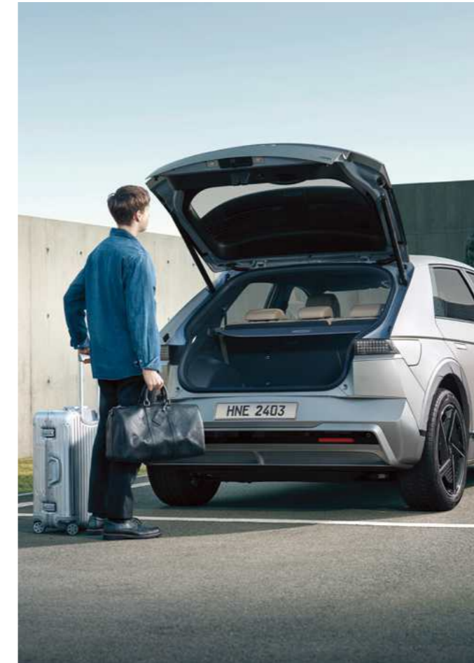
דלת תא מטען חשמלית חכמה עם אפשרות לכיוון גובה ומהירות*