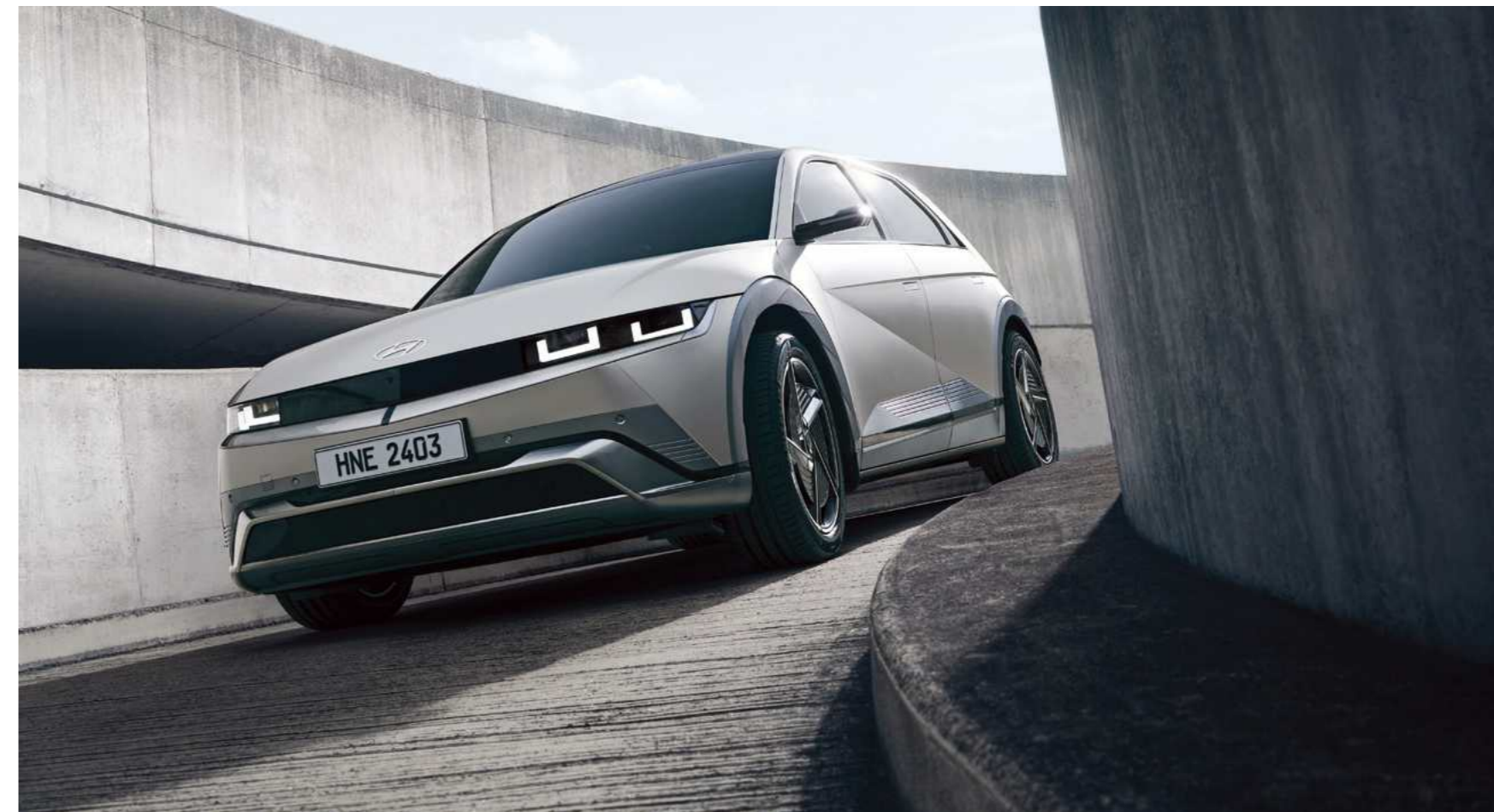
פגוש קדמי רחב המשלב פנסי LED