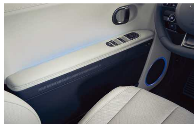
תאורת אווירה משתנה*