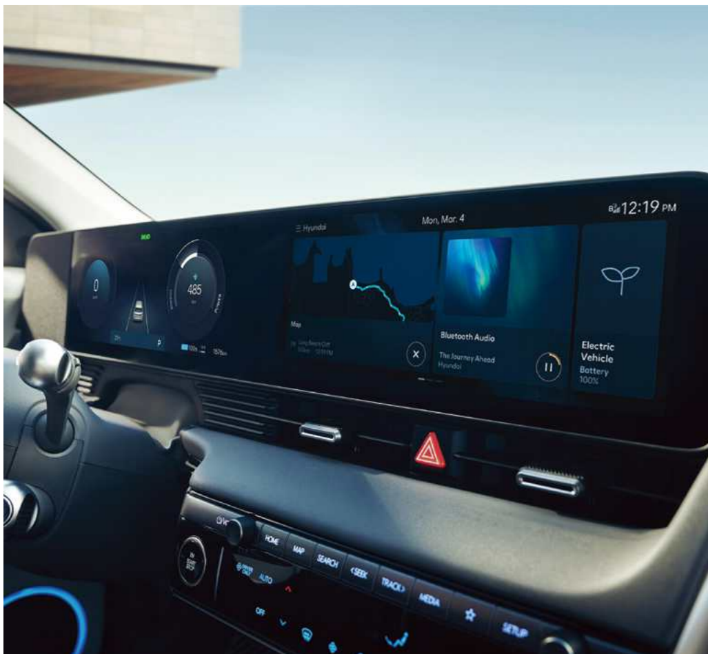
צג רחב המשלב מערכת מולטימדיה ולוח מחוונים בגודל 12.3"

יונדאי IONIQ 5 משדרגת את היום-יום שלכם. השילוב בין יכולות דיגיטליות מתקדמות ופונקציונליות המציעים נוחות אינטואיטיבית.