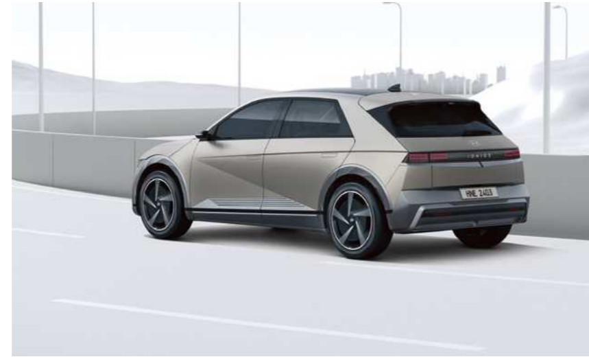
בקרת שיוט חכמה הכוללת מנגנון זחילה בפקקים (SCC)

מערכת אקטיבית הכוללת תיקון הגה לסיוע בשמירה על נתיב הנסיעה. כאשר המערכת מזהה סטייה מנתיב הנסיעה, היא מבצעת תיקון הגה אוטומטי בכדי למנוע את הסטייה מנתיב הנסיעה.