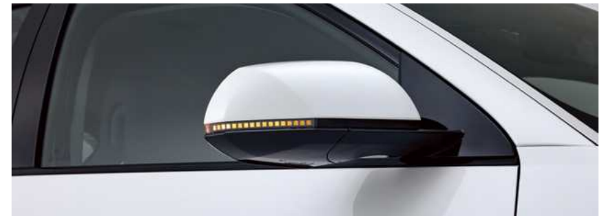
פנסי איתות במראות LED