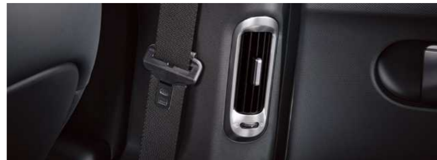
פתחי מיזוג אוויר למושב האחור