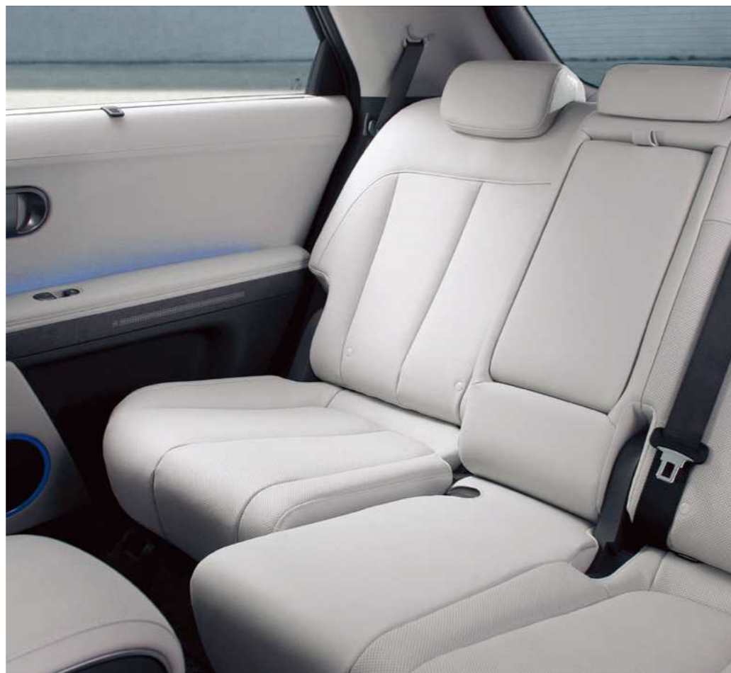
מושב אחורי עם אפשרות לכיוון חשמלי*