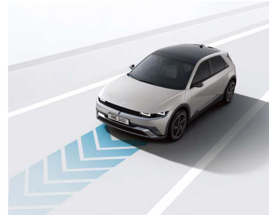
מערכת סיוע לשמירה על מרכז נתיב הנסיעה (LFA)

מערכת מבוססת רדאר המתריעה על רכבים ב"שטח מת" בעת מעבר נתיב ומבצעת תיקון הגה אוטומטי במידה והנתיב אינו פנוי.