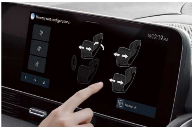
כיוון מושבים חשמלי ממסך המולטימדיה*

שילוב חומרים יוקרתיים בעיצוב מינימליסטי מעניק לכם נוחות מקסימלית בחלל הפנים.