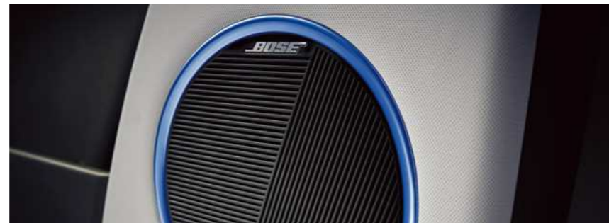
מערכת שמע מבית BOSE*