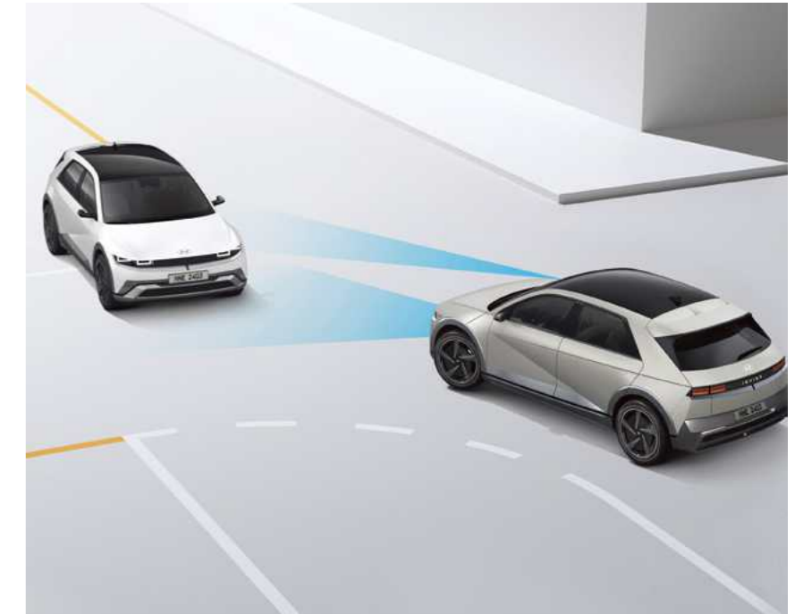
בלימה אוטונומית במצבי חירום (FCA-JT)

מערכת אקטיבית המסייעת בשמירה על מרכז נתיב הנסיעה.