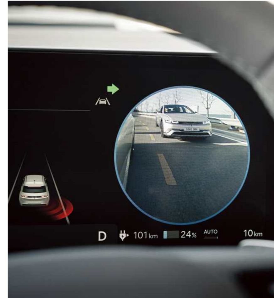
הצגת צילום חי של "שטח מת" על גבי לוח המחוונים הדיגיטלי בעת הפעלת איתות (BVM)*