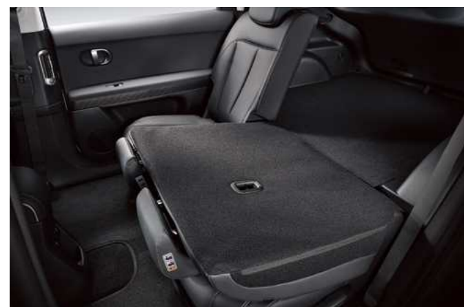
קיפול מושבים אחוריים