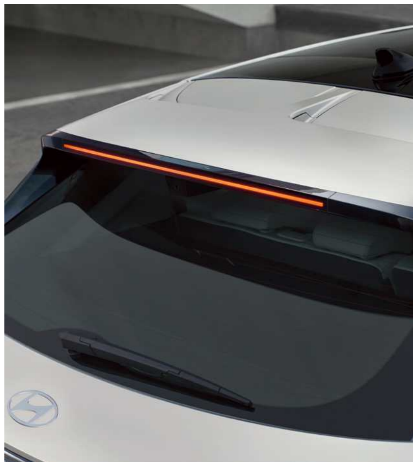
ספילר אחורי אווירודינמי בגג