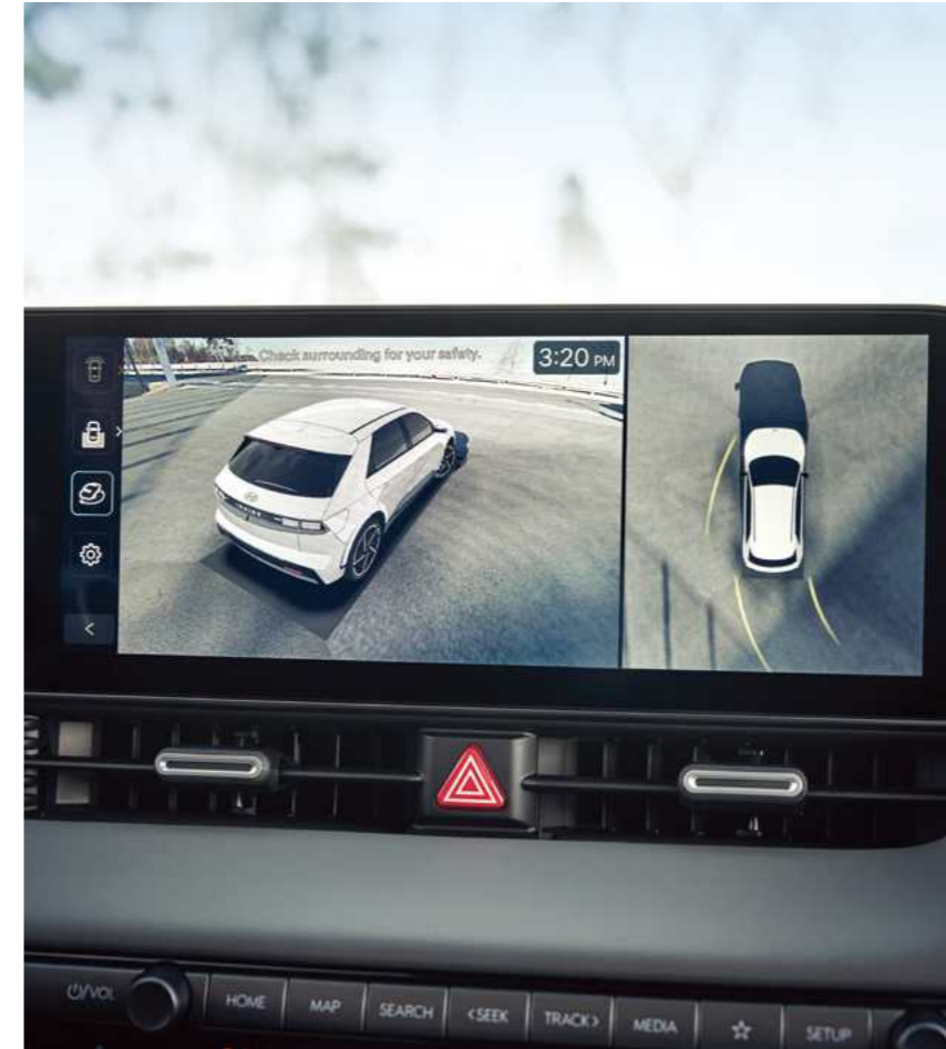
מערך מצלמות היקפי (SVM)*