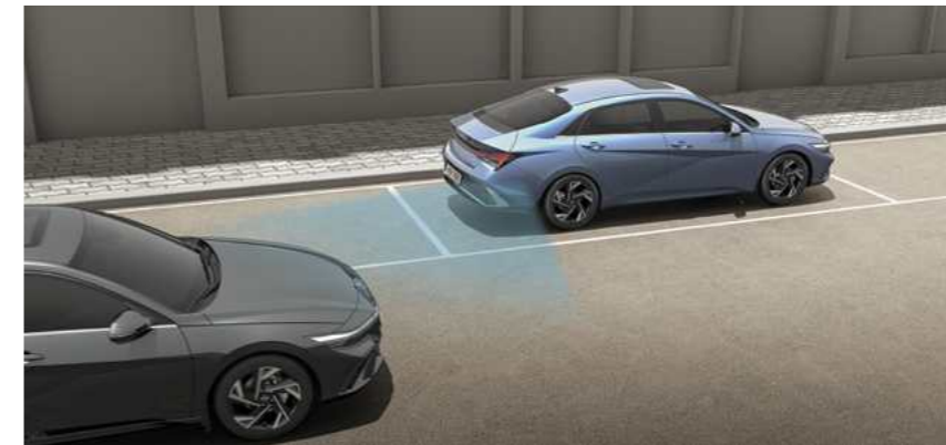
מערכת אקטיבית לציאה בטוחה מהרכב (SEA)* מערכת "ציאה בטוחה" המתריעה ומונעת פתיחת דלתות המושב האחורי במקרה של רכב חוצה.