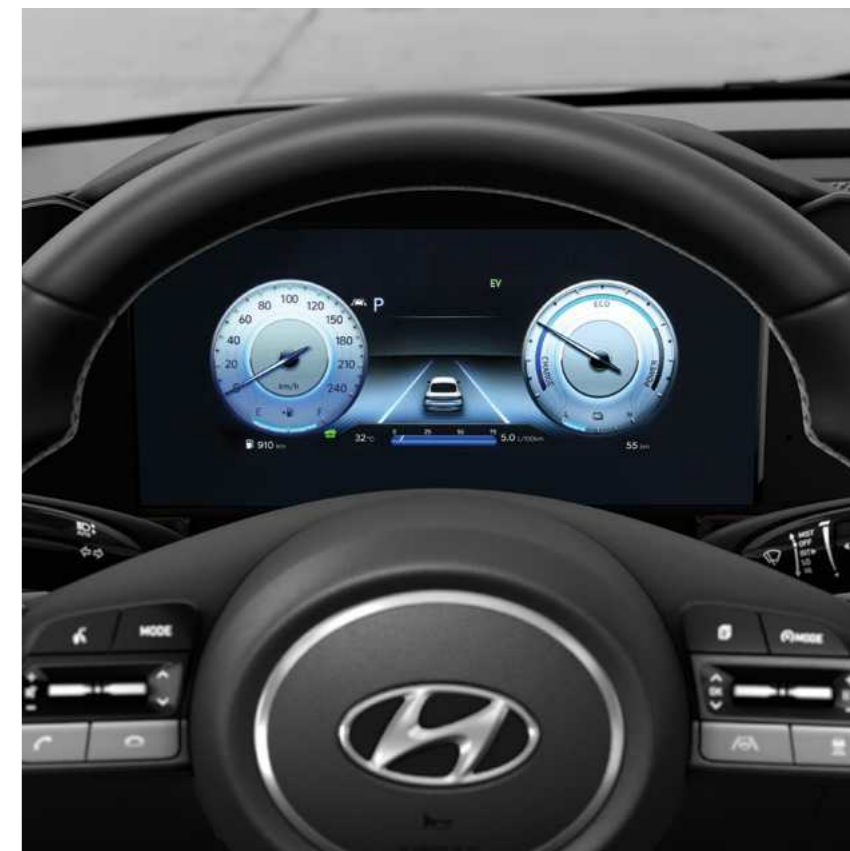
SVC - לוח מחוונים דיגיטלי מלא עם תצוגה משתנה *10.25"