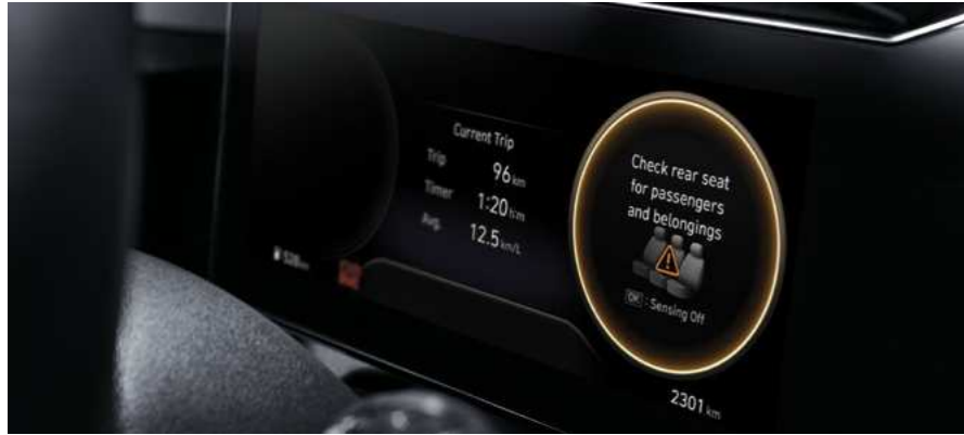
חיווי תזכורת למניעת שכחת נוסע במושב האחורי (ROA) מערכת ROA המתריעה על שכחת ילד/נוסע במושב האחורי.