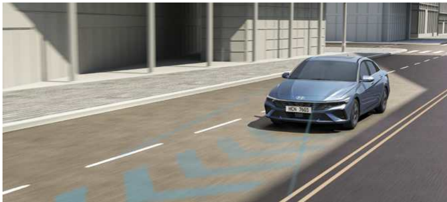
מערכת סיוע לשמירה על מרכז נתיב הנסיעה (LFA) מערכת אקטיבית המסייעת בשמירה על מרכז נתיב הנסיעה.