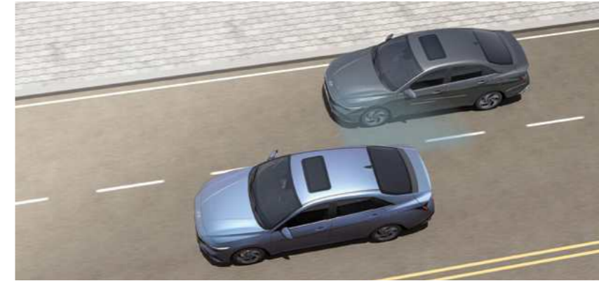
מערכת אקטיבית לזיהוי ומניעת התנגשות בכלי רכב ב"שטח מת" (BCA)* מערכת מבוססת רדאר המתריעה על רכבים ב"שטח מת" בעת מעבר נתיב ומבצעת תיקון הגה אוטומטי במידה והנתיב אינו פנוי.