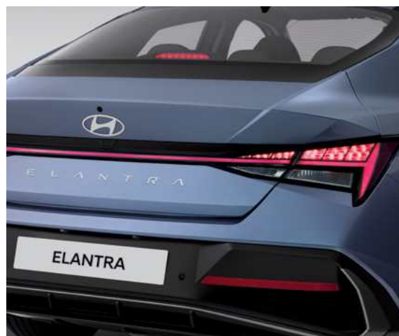
פנסים אחוריים מסוג LED