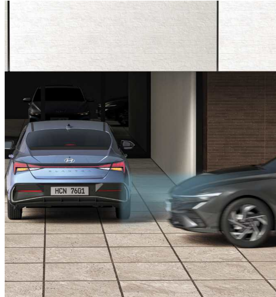
התרעה ומניעת פגיעה ברכב חוצה מאחור (RCCA)* מערכת אקטיבית למניעת פגיעה ברכב חוצה בעת נסיעה לאחור.