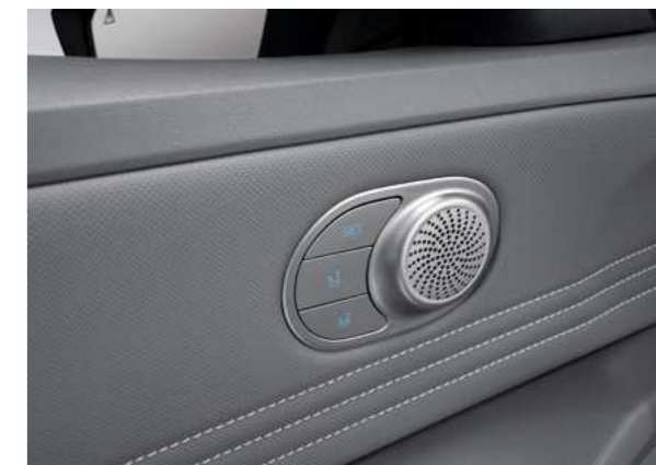
זכרונות למושב נהג*