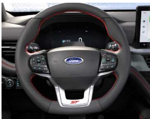
הגה ספורטיבי עם פקדי העברת הילוכים