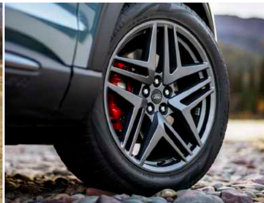
חישוקי סגסוגת קלה 21" שחורים וקאליפרים אדומים