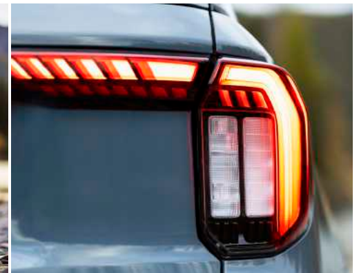
פנסי חזית ופנסים אחוריים מסוג LED