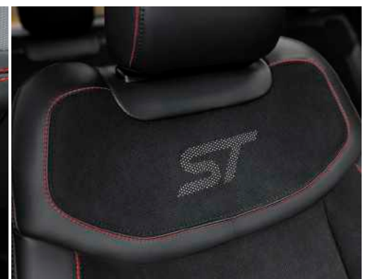
ריפודי Active X בגוון שחור ותפרים אדומים