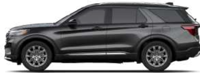
Carbonized Gray (M7)