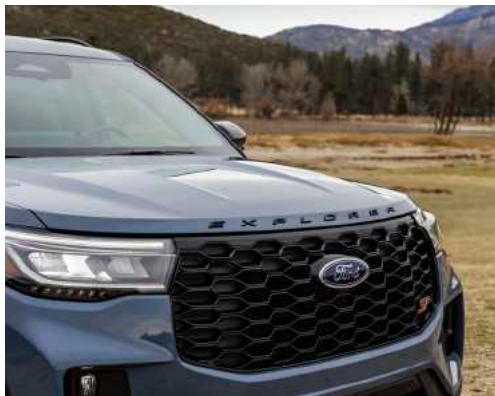
שבכה קדמית בגימור שחור