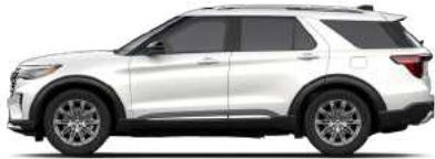
Star White (AZ)*