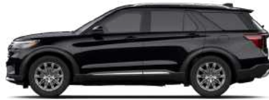
Agate Black (UM)