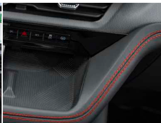
גימורים ייחודיים בתא הנוסעים