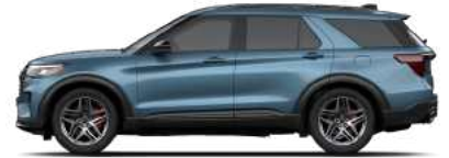
Vapor Blue (K1)* זמין רק ב-ST