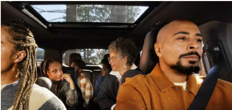
חלון שמש פנוראמי