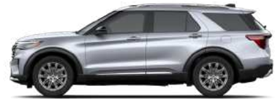
Iconic Silver (J5) זמין רק בדגם Platinum