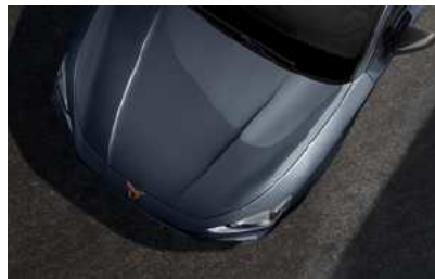
*אפור מטאלי S7S7