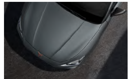
**אפור ירקרק מט Q7Q7