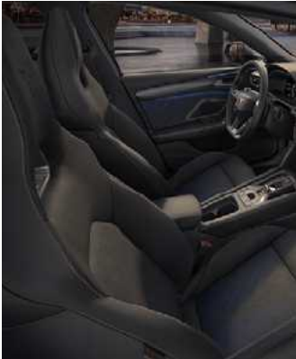
מושבֵי באקט מעור vz