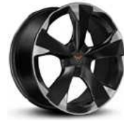
STD 18" s

סטנדרט s סטנדרט vz אופציה בתוספת תשלום vz