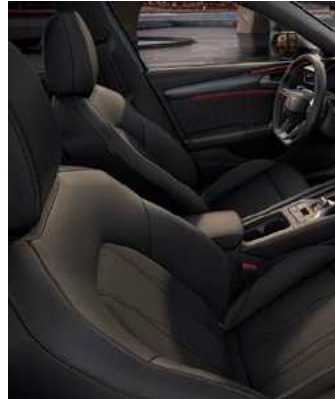
מושבֵי ספורט s