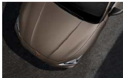
**ברונזה מט L3L3