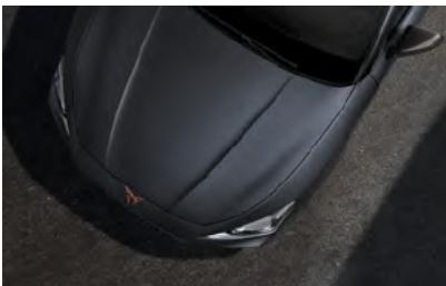
*אפור מט 9R9R