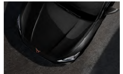
*שחור מטאלי 0E0E