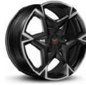
STD 19" vz