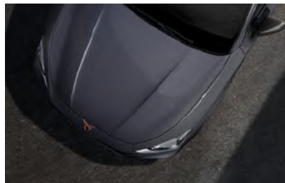
*אפור גרפיט R6R6