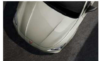
*אפור בז' 4U4U