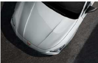
*לבן נבאדה 2Y2Y