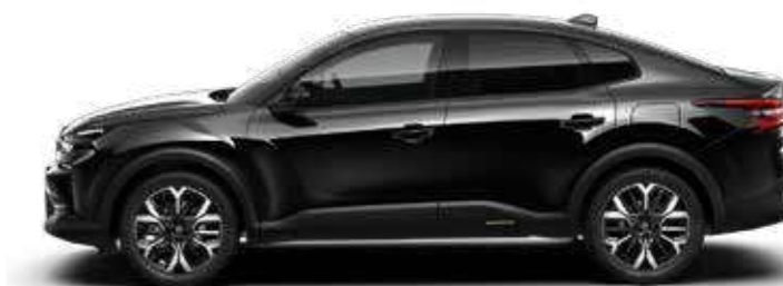
שחור מטאלי - PERLA NERA BLACK