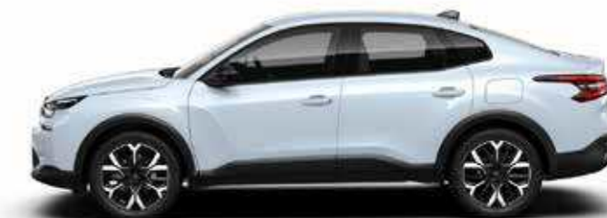
לבן מטאלי - OKENITE WHITE