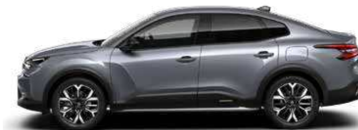
אפור כהה מטאלי - MERCURY GREY