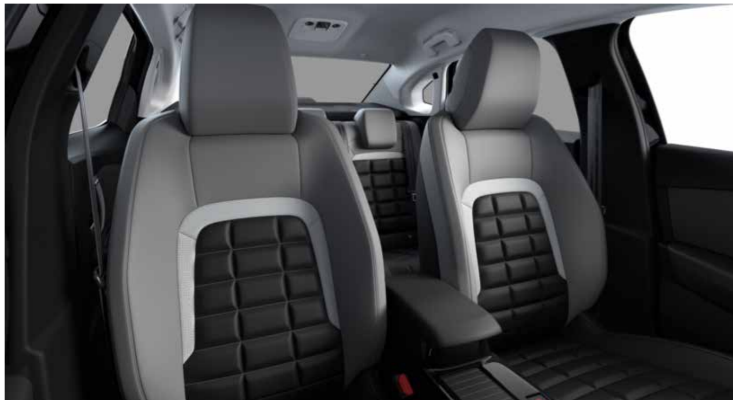
METROPOLITAN GREY AMBIENCE ריפוד עור מלאכותי אפור בשילוב שחור