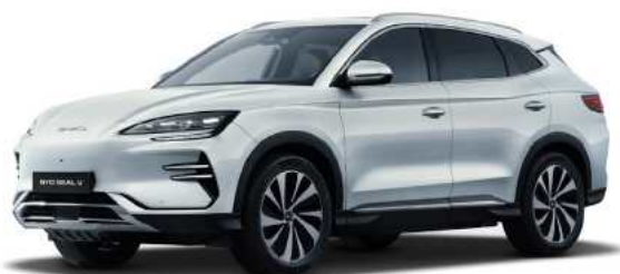
Snow white (WHIT)