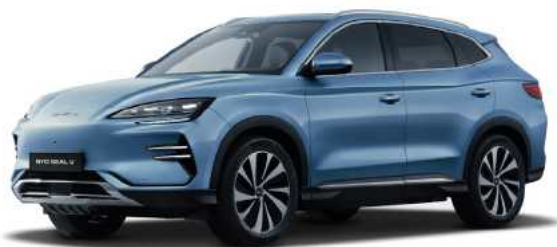
Tian Qing (BLUE)