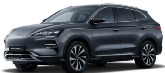
Time Grey (GREY)