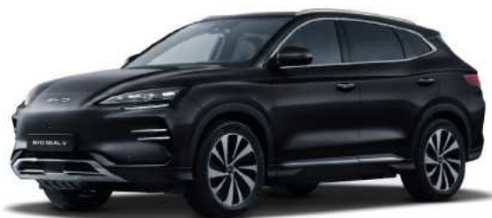
Delan Black (BLAC)