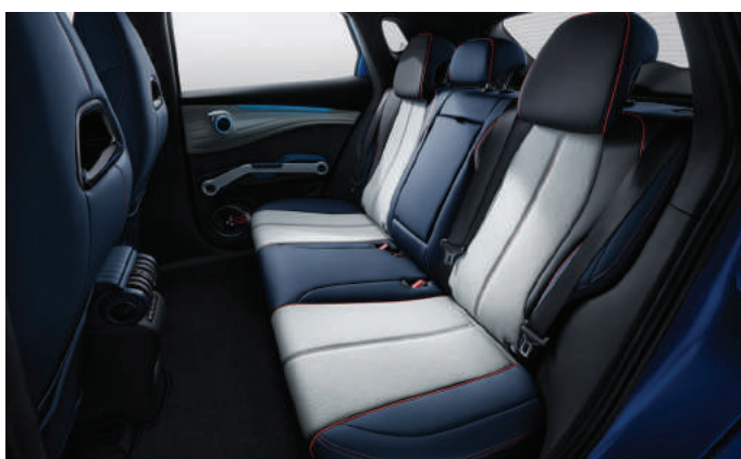
Blue & Grey